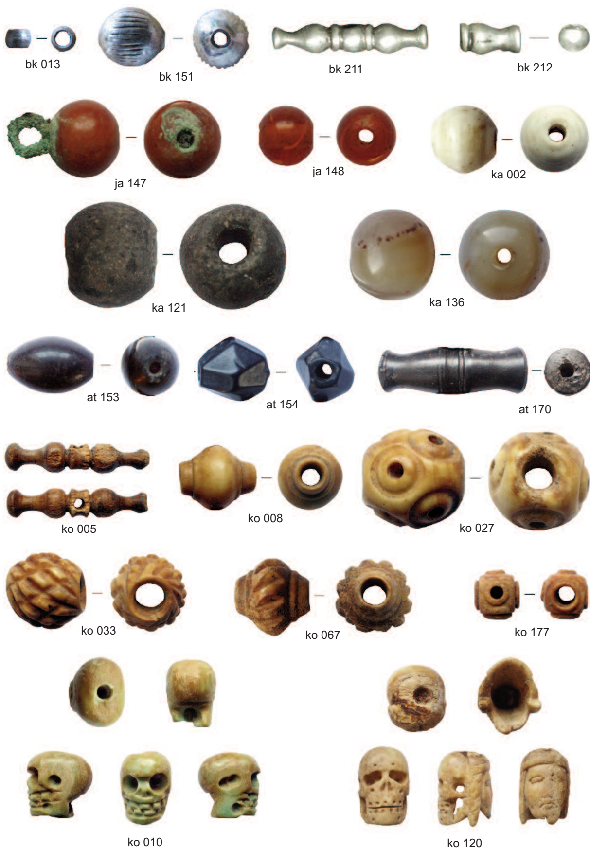
Fototab. 16. Praha-Malá Strana, Šporkova ulice, zaniklý hřbitov při kostelu sv. Jana. Korálky z barevných kovů (bk), jantaru (ja), kamene (ka), antipathes (at; výběr) a kosti (ko; výběr) (k článku M. Omelky a O. Řebounové Soubor korálků ze zaniklého hřbitova ... , s. 887–961)