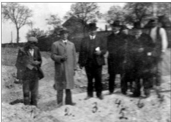
Obr. 2. Dobová fotografie účastníků výzkumu.