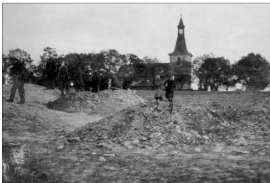
Obr. 1. Celkový pohled na plochu výzkumu. Kronika obce Dřetovice