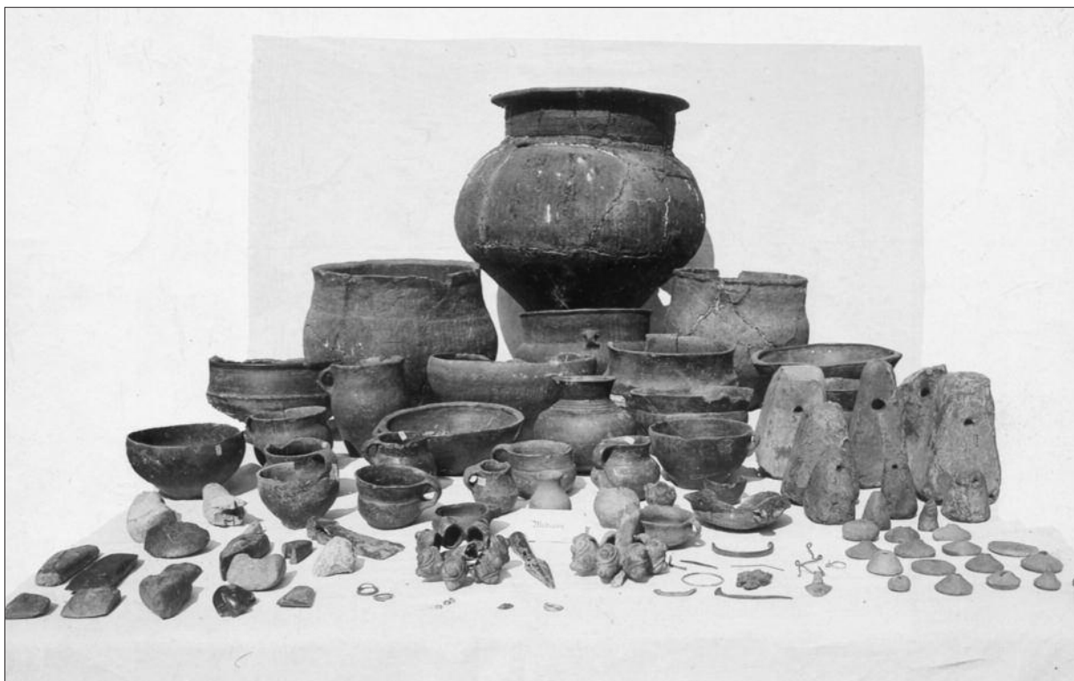
Obr. 3. Dobová fotografie sbírky řídicího učitele F. Hrdiny z Modřan