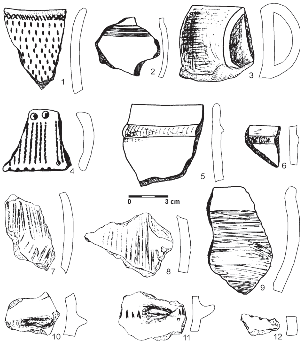
Obr. 3. 1–6, 9 Újezd nad Zbečnem 1, keramické nálezy získané roku 1953; 8, 11, 12 Újezd nad Zbečnem 1, keramické nálezy z povrchové prospekce v roce 2007; 7, 10 Račice nad Berouňkou, keramické nálezy z povrchové prospekce v roce 2007. Kresba I. Košátková a I. Vajgllová

ment výdutě světle oranžové barvy se stopami slámování ( obr. 3:7 ) a zlomek s jazykovitým výčnělkem (ten je částečně odlomen, jeho původní šířka byla cca 3 cm; obr. 3:10 ).