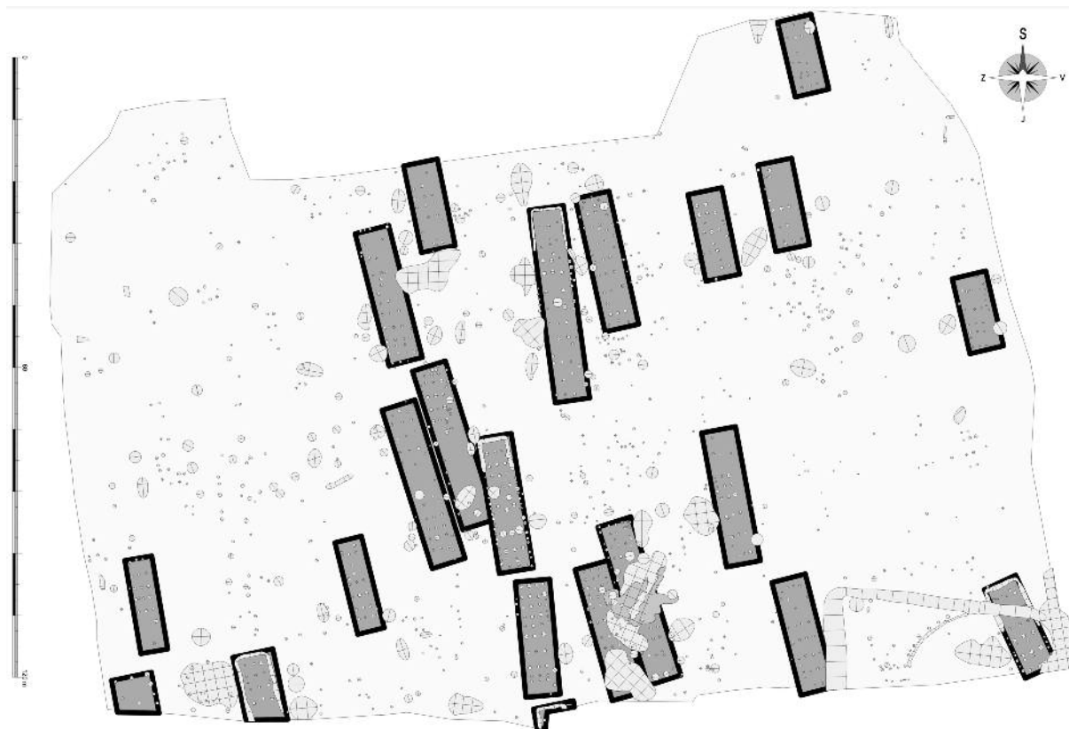
Obr. 2. Brandýs nad Labem, celkový plán výzkumu v roce 2008 se zvýrazněnými stěnami neolitických dlouhých domů (autor: M. Kotek)

Hospodářské jámy nebo podlouhlé příkopy podél stěn domů (tzv. stavební jámy) byly v Brandýse spíše sporadické. V několika případech bylo pozorováno zahlobnutí takových jam do tmavé výplně mrazových klínů, jejichž prostupnost byla zřejmě snazší než pískovcově jílovité podloží místy přecházející ve zvětralou skálu. V jednom případě byly základové jamky sloupů dlouhého domu vysekány přímo do navětralé skály. Relativně malému počtu sídlištních jam také odpovídá nižší počet keramických nálezů, zvířecích kostí a broušené i štípané industrie.