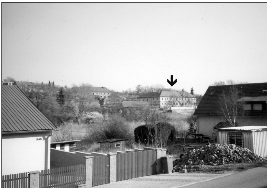
Obr. 2. Statenice od jihozápadu (2007). Šipkou označena poloha pohřebiště na horním okraji svahu do údolí potoka (za zámek, resp. nad ním poněkud vyčnívá střecha špýcharu)

dobrovolný důchodce P. Václav Krolmus, tehdy už sbírající pro Národní muzeum, získal přímo od hraběnky Khuenburgové nejen informace o nich, ale i zachráněné nálezy samé jako dar pro Národní muzeum. Zaznamenal to ve své rukopisné zprávě, kterou ještě téhož roku předal Muzeu jako doprovod k předávaným nálezům – proto jsou v textu pořadová čísla, jimiž byly předměty označeny. (Viz příloha 2; Sklenář 1972 , 56–57.)