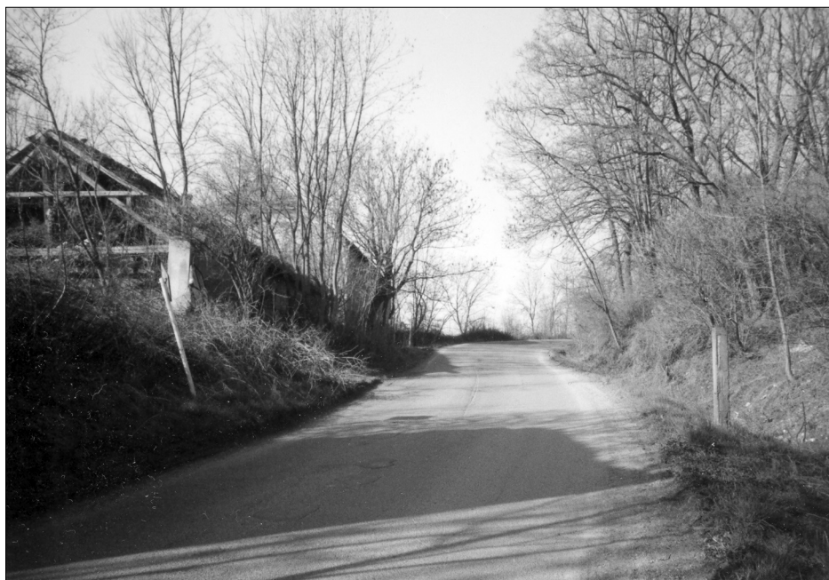
Obr. 3. Průkop cesty (dnešní silnice) ze Statenic do Lichocevsí. Vlevo v pozadí špýchar, v popředí zříceniny sousedního objektu, zřejmě někdejšího ovčína