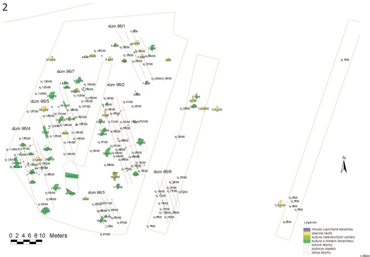
Fototab. 18. Krbice u Chomutova. 1 – celkový plán zkoumané plochy polykulturního sídelního areálu; 2 – plocha I-III/1996 s předpokládanými půdorysy domů (k článku Aleše Káčerika Polykulturní sídelní areál v Krbicích u Chomutova: Analýza a syntéza neolitické komponenty , str. 653–703)