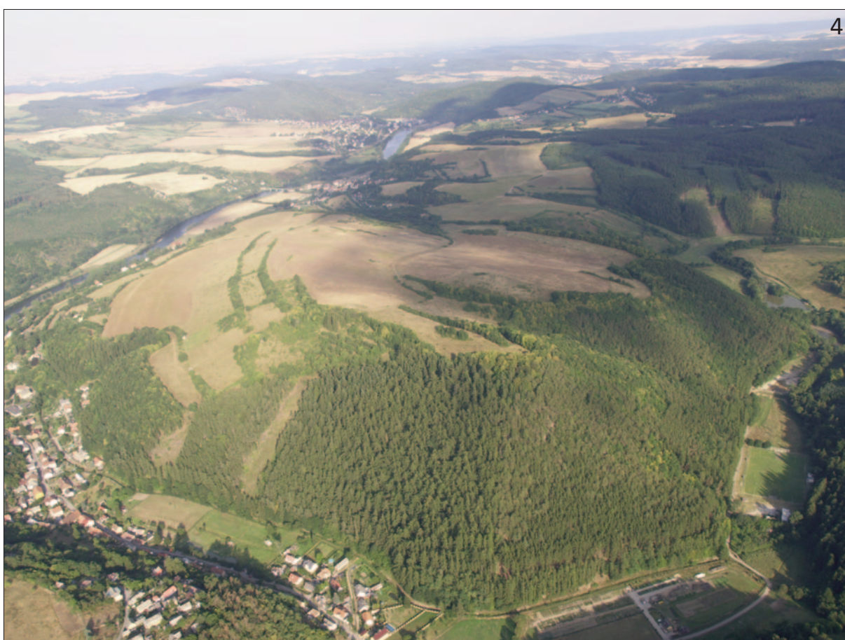
Fototab. 1. Hradiště a oppida. 1 – Třísov; 2 – Praha-Královice; 3 – Libušín (akropole); 4 – Stradonice. Foto I. Benková (k článku I. Benkové: 15 let letecké prospekce v Ústavu archeologické památkové péče středních Čech , str. 15–16)