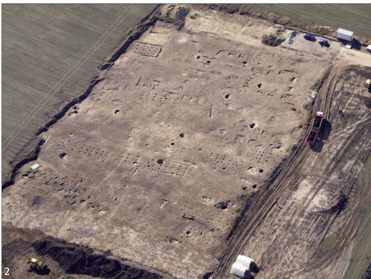
Fototab. 3. Fotodokumentace velkoplošných výzkumů. 1 – Zdiby (výzkum L. Balouna); 2 – Brandýs nad Labem (výzkum J. Turka). (k článku I. Benkové: 15 let letecké prospekce v Ústavu archeologické památkové péče středních Čech , str. 15–16)