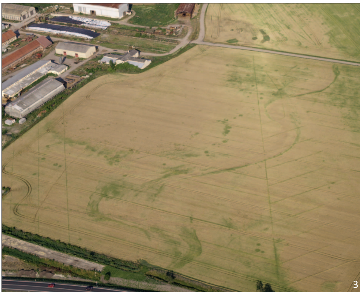
Fototab. 2. Prospekce a dokumentace, Kolínsko. 1 – Libenice-Skalka, polykulturní lokalita; 2 – Ohaře, patrně knovízské sídliště; 3 – Ovčáry, původní meandry Hlubokého potoka, archeologické objekty, meliorace. (k článku I. Benkové: 15 let letecké prospekce v Ústavu archeologické památkové péče středních Čech , str. 15–16)