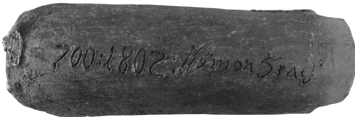
Obr. 3. Prejz z roku 1802 vyrobený píseckým cihlářem Šimonem Hrachem. Muzeum Písek, inv. č. HE 3983