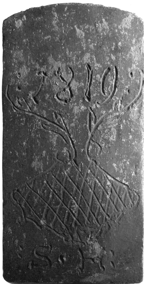
Obr. 5. Bobrovka z roku 1819 signovaná S. H. Muzeum Písek, inv. č. HE 3982