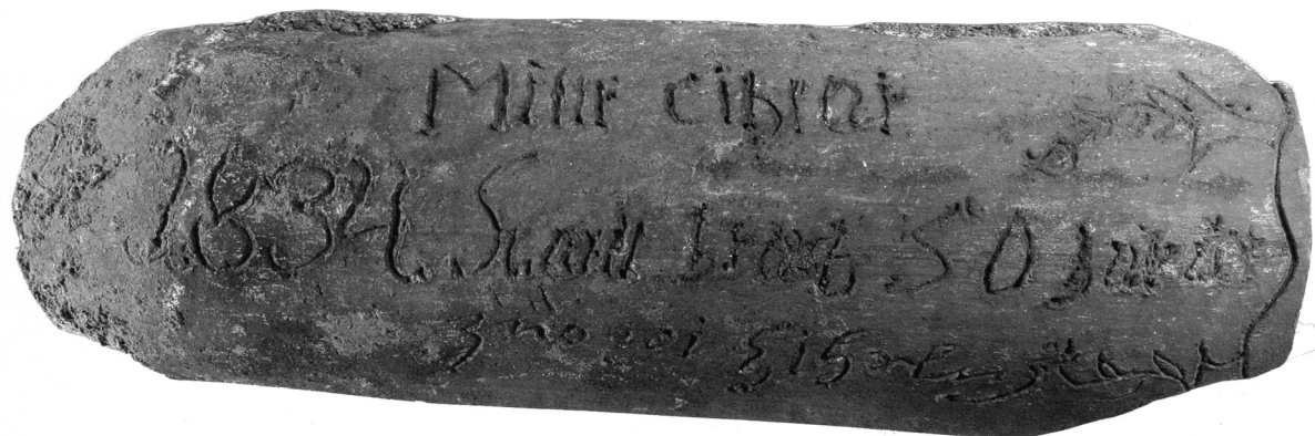
Obr. 4. Prejz z roku 1834 vyrobený píseckým cihlářem Karlem Hrachem. Muzeum Písek, inv. č. HE 3984