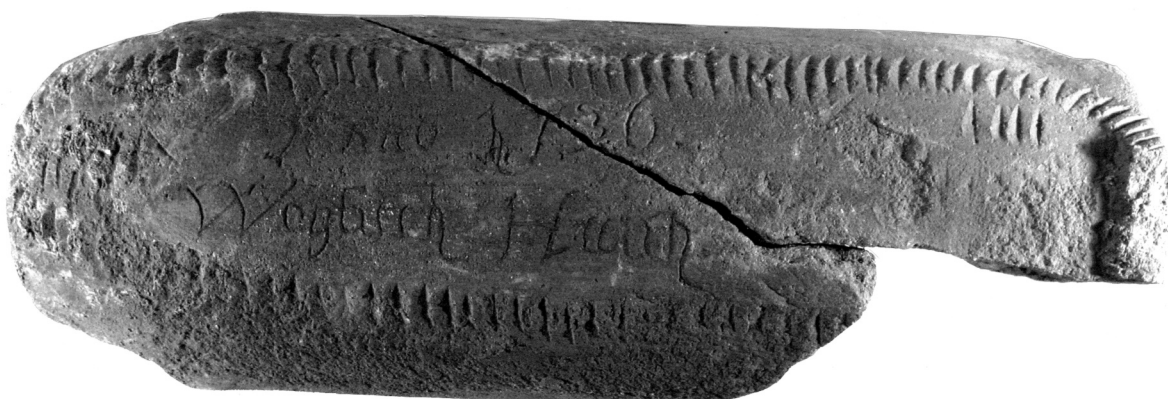
Obr. 2. Prejz z roku 1736 vyrobený píseckým cihlářem Vojtěchem Hrachem. Muzeum Písek, inv. č. HE 3986–3987