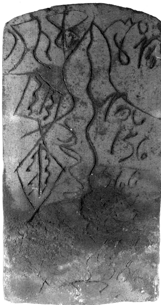
Obr. 8. Blíže nedatovaná bobrovka. Muzeum Písek, inv. č. HE 3980

První pochází z Jamného a druhá z již uvedeného čp. 10 ve Smrkovicích. Nápisy na těchto taškách byly adresovány majitelům domů a z toho důvodu byly na spodní straně přístupné z půdy. Zcela kuriózní je taška ze Šamonice s obscénními rytinami – postavou ženy s rohy, ženskými přirozeními a větvičkou. Po straně má nápis Josef Wota(w)a Kovář psal (obr. 11). Podle typu písma byla vyrobena kolem poloviny 19. století, případně již v první polovině 19. století.