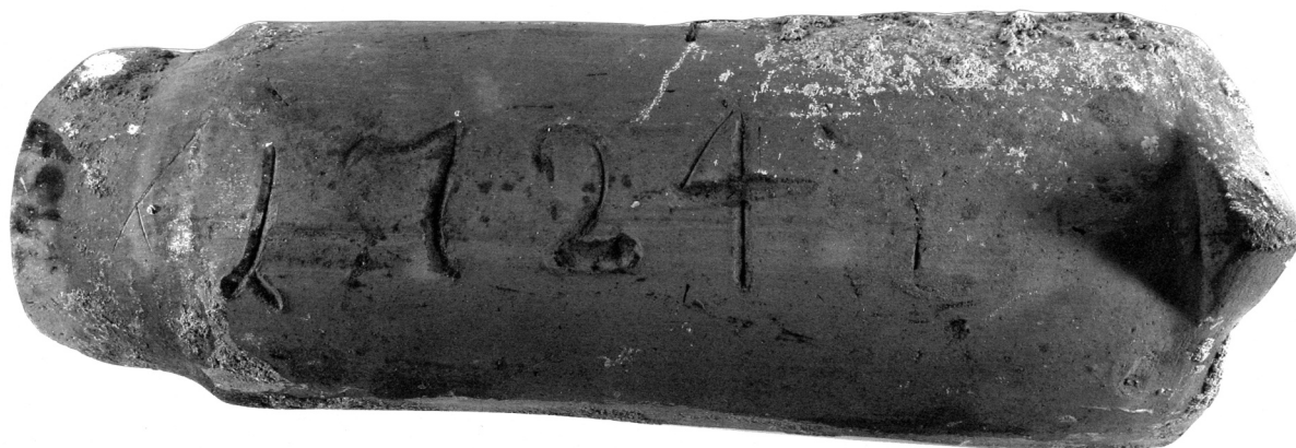
Obr. 1. Prejz z roku 1724. Muzeum Písek, inv. č. HE 3985