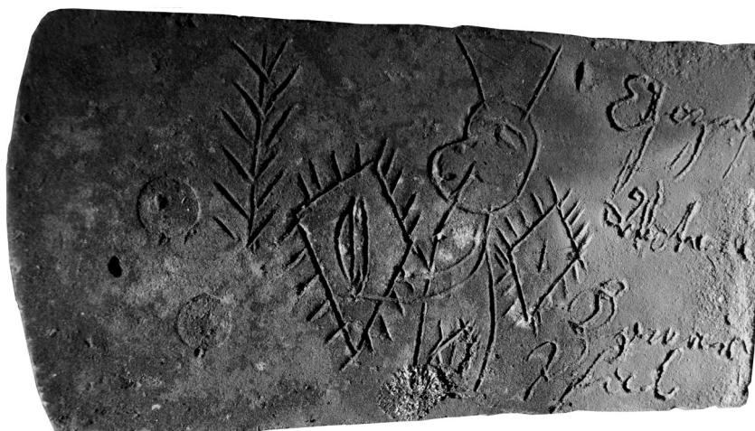
Obr. 11. Bobrovka s obscénním graffiti z poloviny 19. století ze Šamonice, okr. Písek.

Přesně datovaná keramická střešní krytina upřesňuje pohled na vývoj použití tohoto druhu stavebního materiálu. Přispívá k datování objektů a může napomoci i k datování archeologických nálezů. Článek je zároveň upozorněním na možnost její existence ještě na původních střeších staveb.