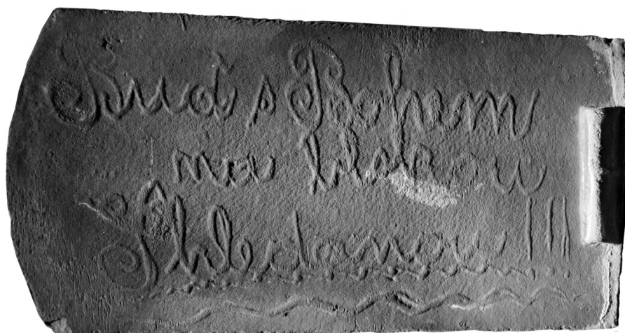
Obr. 10. Bobrovka s nápisem z počátku 20. století z Jamného, okr. Písek

cihláře, majitele cihelny a datem výroby 25/6 1887, vyrobená v cihelně v Pfaffstettenu ( Papp – Roetzel – Wimmer-Frey 2003, 134, Abb. 9 ).