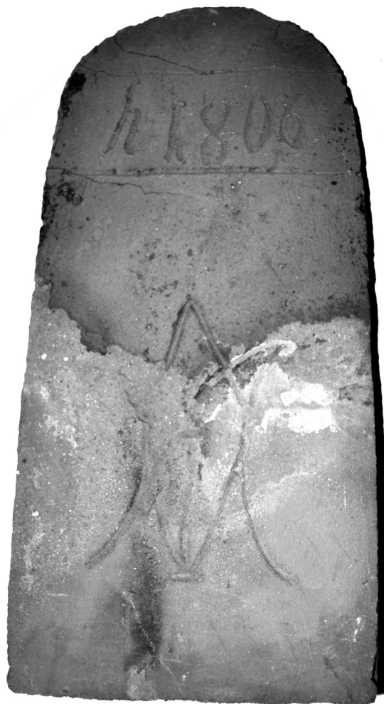
Obr. 9. Bobrovka z roku 1806 z Budičovic, okr. Písek

Z Polska jsou publikovány signované, zdobené a nápisové tašky datované letopočty do 19. století (Wijas-Grocholska 2010; Kurowska 2011). V Dolním Rakousku je např. doložena taška s rytým jménem