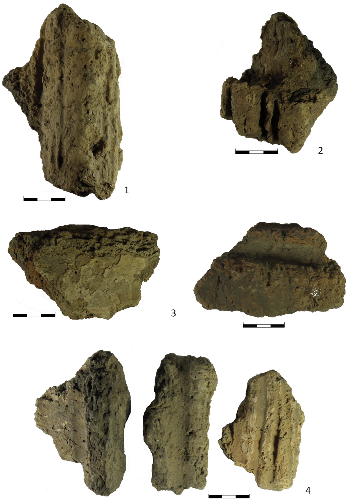
Fototab. 11. Postoloprty, okr. Louny. Objekt 18: 1 – zlomek č. 16; 2 – zlomek č. 17; objekt 19: 3 – zlomek č. 20; 4 – zlomky č. 21–23 (k článku M. Ličky: K otázce interpretace zahloubených objektů uvnitř pozdněengyelského domu z Postoloprty, okr. Louny, str. 623–648 )