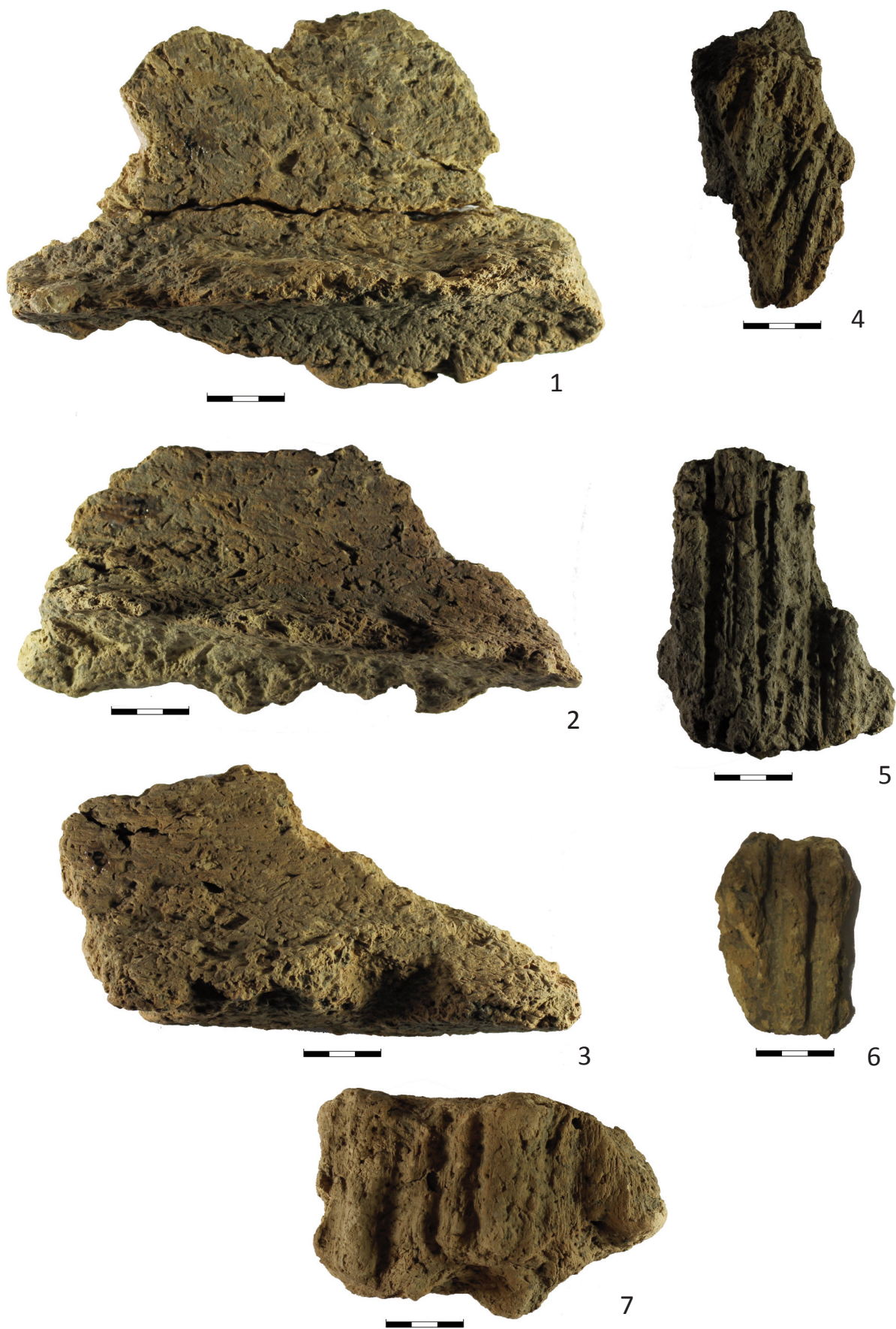
Fototab. 9. Postoloprty, okr. Louny. Objekt 16. 1–7 – zlomky mazanice č. 1–7 (k článku M. Ličky: K otázce interpretace zahloubených objektů uvnitř pozdnělengyelského domu z Postoloprty, okr. Louny, str. 623–648 )