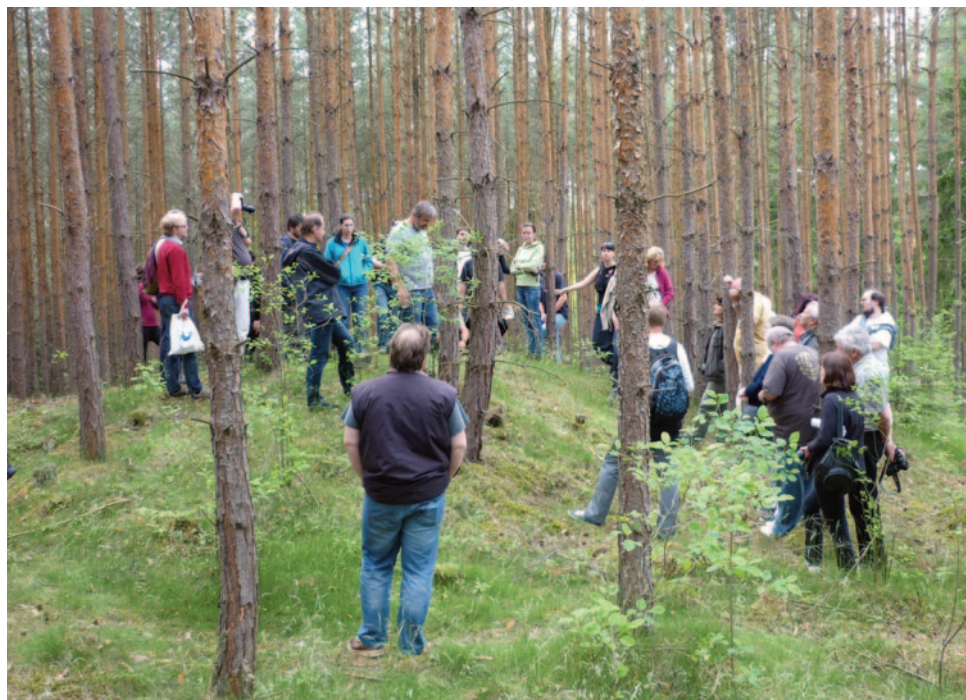
Obr. 37. XLII. seminář – Stříbro 2014: exkurze na mohylník u Malovic.