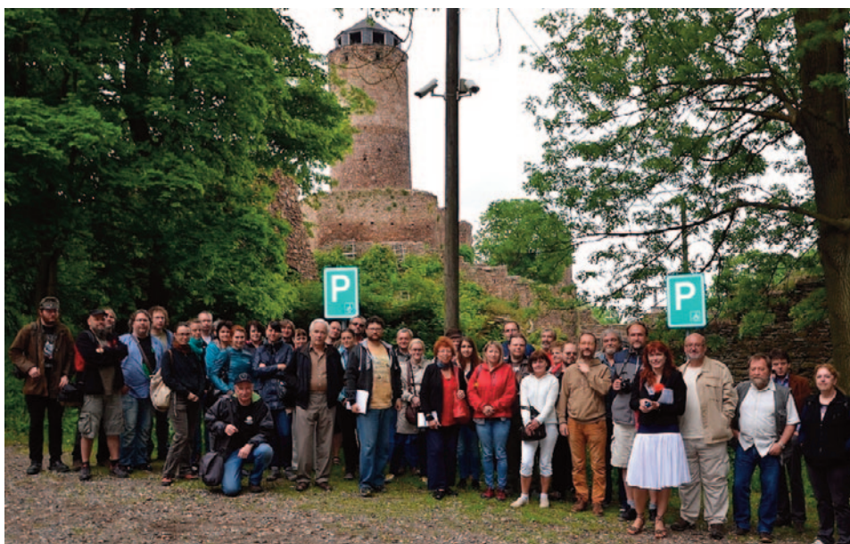
Obr. 42. XLIV. seminář – Most 2016: po přijetí usnesení před hradem Hasištejnem.