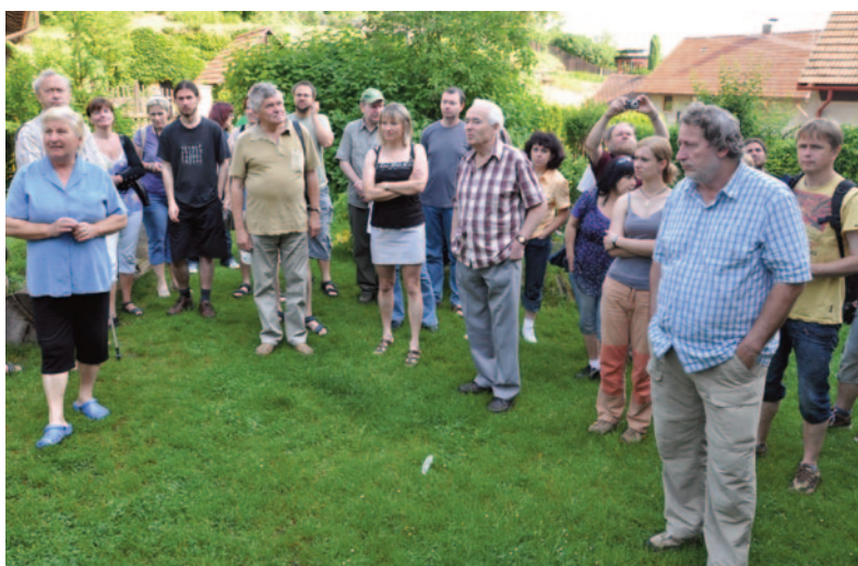
Obr. 33. XXXVIII. seminář – Mělník 2010: exkurze do skalního obydlí ve Lhotce.