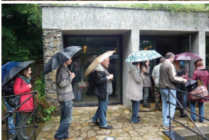
Obr. 35. XLI. seminář – Hranice 2013: exkurze do památníku v Předmostí.