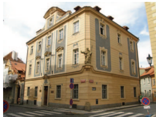
Obr. 7. Lužický seminář na Malé Straně v Praze: v prostorách Ústředního muzeologického kabinetu působila komise v letech 1974–1990.