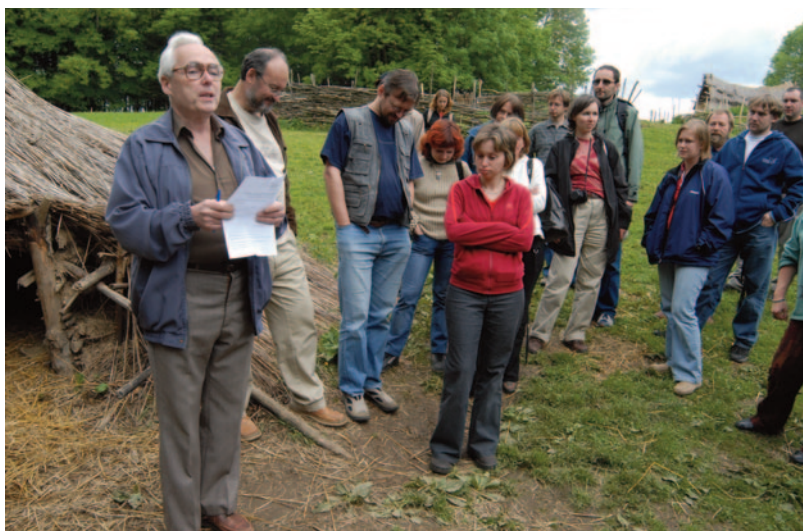
Obr. 28. XXXIV. seminář – Rychnov nad Kněžnou 2006: usnesení v archeoskanzenu v Uhřínově.