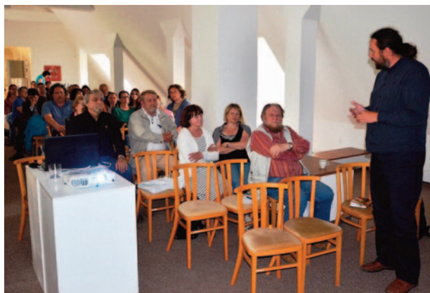
Obr. 41. XLIV. seminář – Most 2016: zasedání v muzeu.