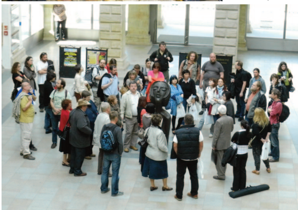
Obr. 36. XLI. seminář – Hranice 2013: přivítání v muzeu.