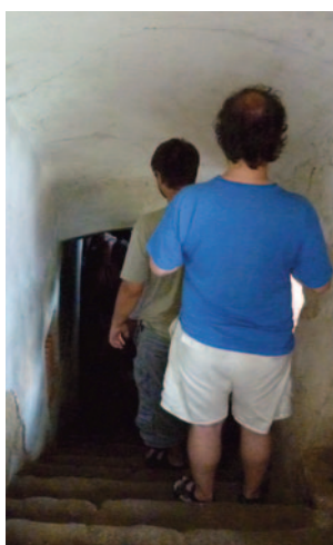
Obr. 32. XXXVIII. seminář – Mělník 2010: sestup do „posledního božičtě Černoboha“ na Skalsku.