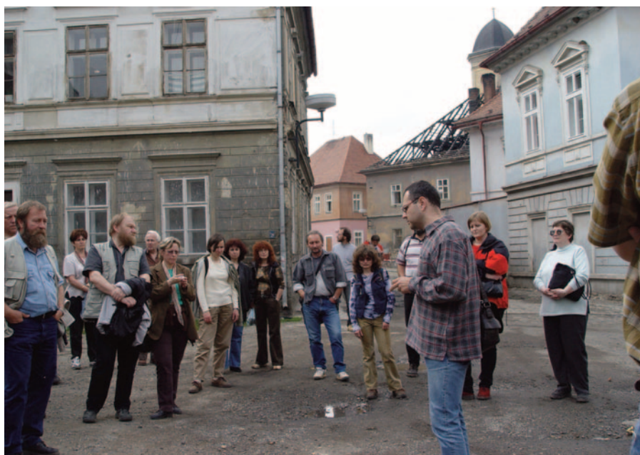
Obr. 25. XXXII. seminář – Louny 2004: exkurze do Žatce.