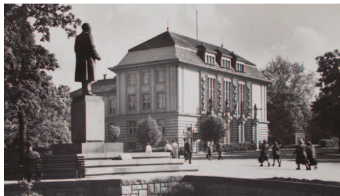
Obr. 6. Osvětový dům v Opavě – místo vzniku oborové komise muzejních archeologů ČSR v roce 1974 (soudobý snímek).