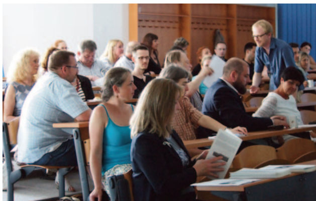
Obr. 44. XLV. seminář – Brno 2017: diskuse na semináři.