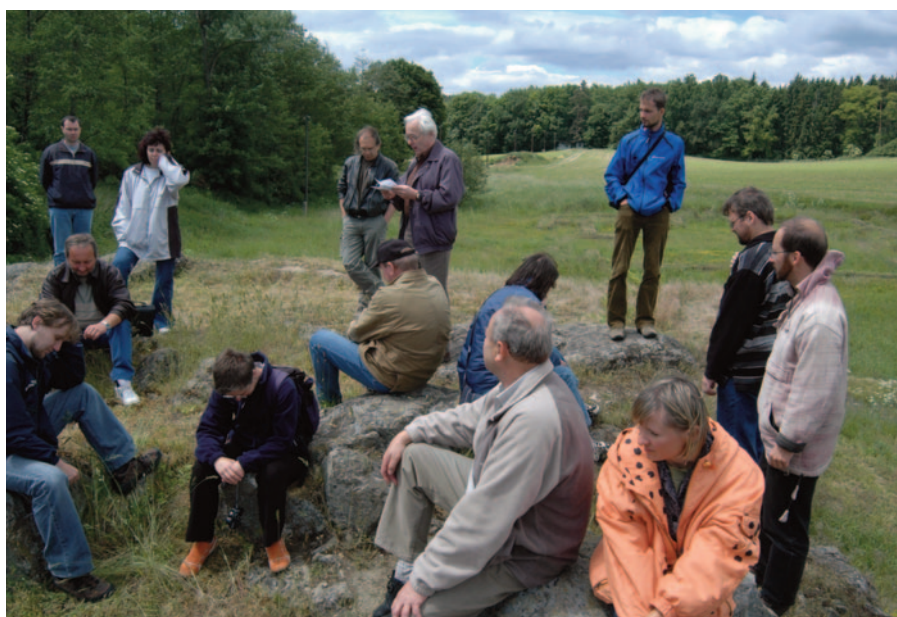
Obr. 26. XXXIII. seminář – Třebíč 2005: usnesení v prostoru zaniklé středověké vsi Mstěnice.