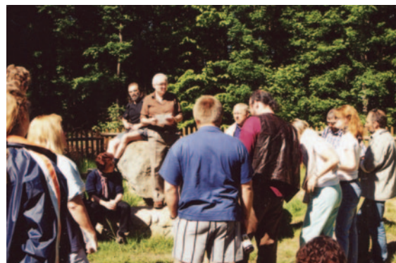
Obr. 21. XXIX. seminář – Uherské Hradiště 2001: usnesení u balvanu Králův stůl.