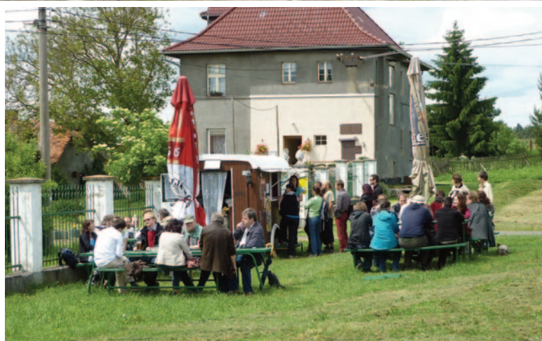
Obr. 39. XLII. seminář – Stříbro 2014: občerstvení u dvora Daňkova nad hradem Gutštejnem.