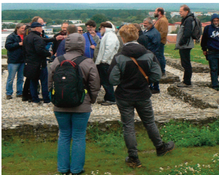
Obr. 50. XLVII. seminář – Uherské Hradiště 2019: exkurze k velkomoravskému kostelu na Sadech.