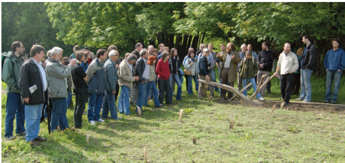
Obr. 27. XXXIV. seminář – Rychnov nad Kněžnou 2006: exkurze do archeoskanzenu Villa Nova v Uhřínově.