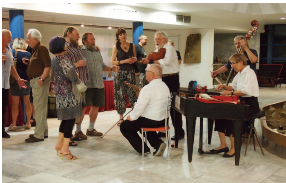
Obr. 46. XLV. seminář – Brno 2017: večerní zasedání u mamuta v muzeu Anthropos.