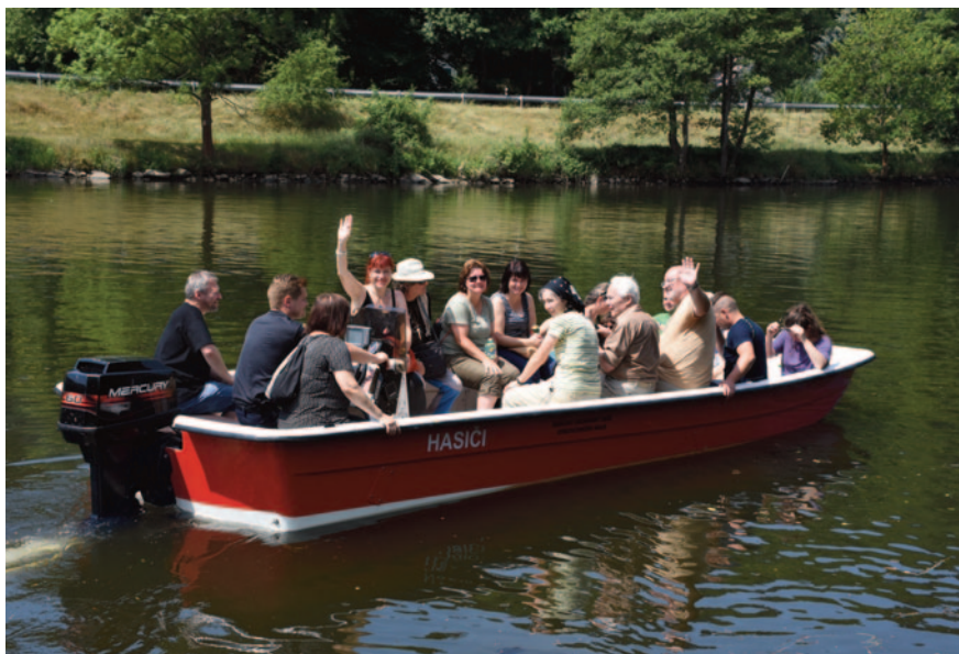
Obr. 48. XLVI. seminář – Jílové u Prahy 2018: přeprava k pozůstatkům kláštera na ostrově ve Vltavě u Davle.