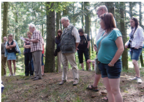
Obr. 40. XLIII. seminář – Jihlava 2015: usnesení na tvrzišti u Nemojova.