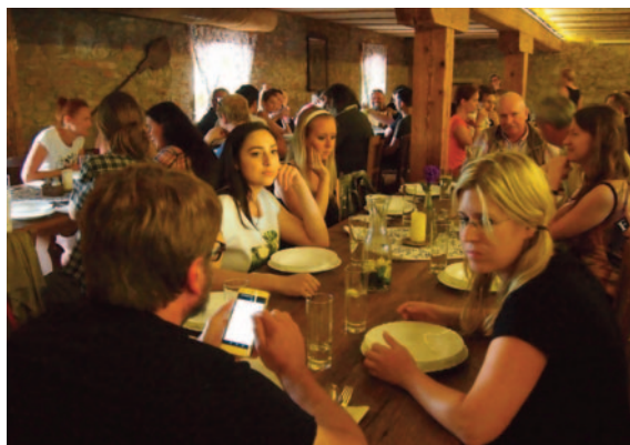
Obr. 45. XLV. seminář – Brno 2017: exkurze – oběd v krčmě U císařské cesty v Branišovicích.