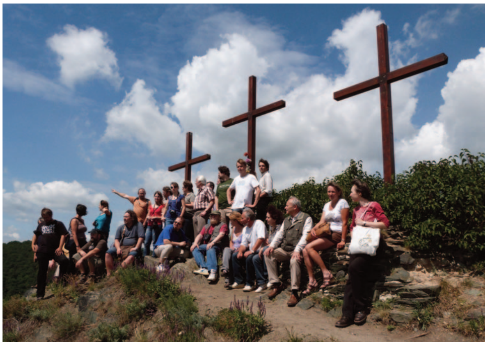
Obr. 34. XL. seminář – Roudnice n. L. 2012: exkurze na Tříkřížový vrch u Litoměřic.