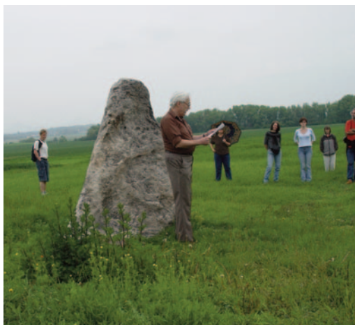
Obr. 24. XXXII. seminář – Louny 2004: usnesení u menhiru u Drahomyšle.