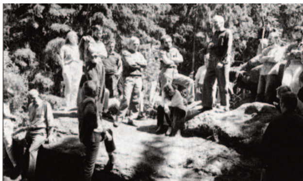
Obr. 20. XXII. seminář – Jindřichův Hradec 1994: přijímání usnesení na „obětních kamenech“ u Landštejna.