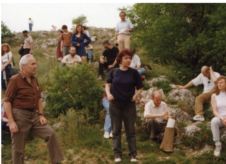
Obr. 22. XXVII. seminář – Břeclav 1999: exkurze na Sirotčí hrad v Pavlovských vrších.