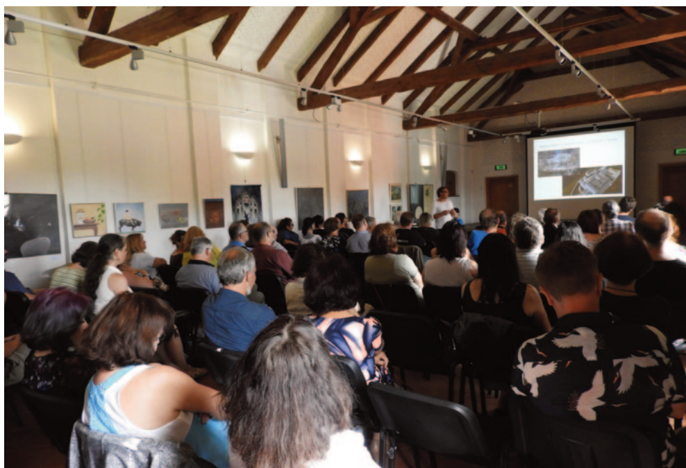
Obr. 47. XLVI. seminář – Jílové u Prahy 2018: přednáška o regionální archeologii.