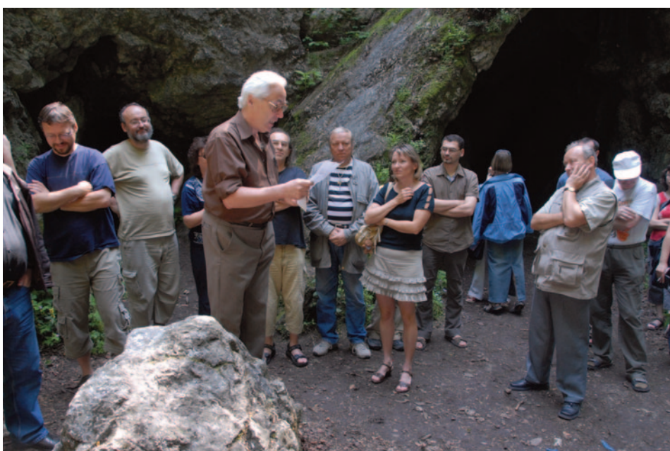
Obr. 29. XXXV. seminář – Nový Jičín 2007: usnesení v jeskyni Šipce u Štramberka.