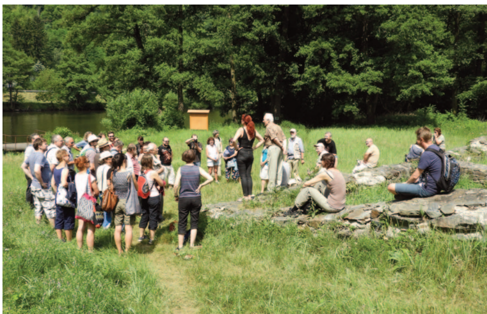
Obr. 49. XLVI. seminář – Jílové u Prahy 2018: usnesení na základech Ostrovského kláštera.