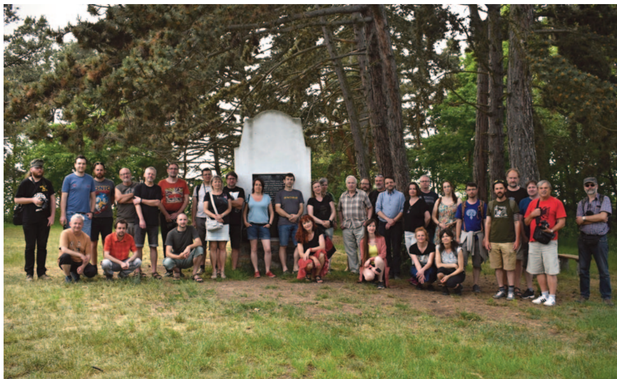
Obr. 52. L. seminář – Kolín 2023: exkurze v místech germánského pohřebiště Dobřichov-Pičhora.