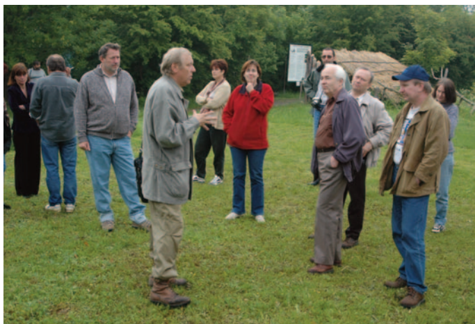
Obr. 23. XXXII. seminář – Louny 2004: exkurze do archeoskanzenu v Březně u Loun.