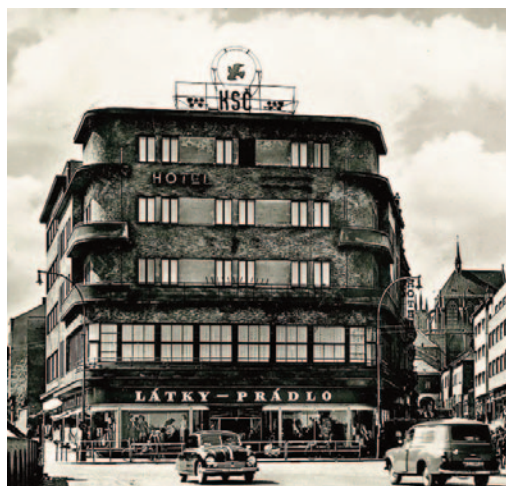
Obr. 5. Hotel Savoy v Kolíně – dějiště prvního „konzultačního dne“ muzejních archeologů (soudobý snímek).