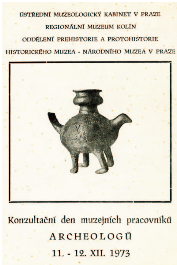
Obr. 4. Pozvánka na konzultační den v Kolíně 1973.