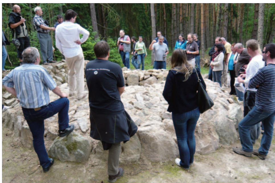
Obr. 38. XLII. seminář – Stříbro 2014: usnesení na rekonstruované mohyle u Butova.