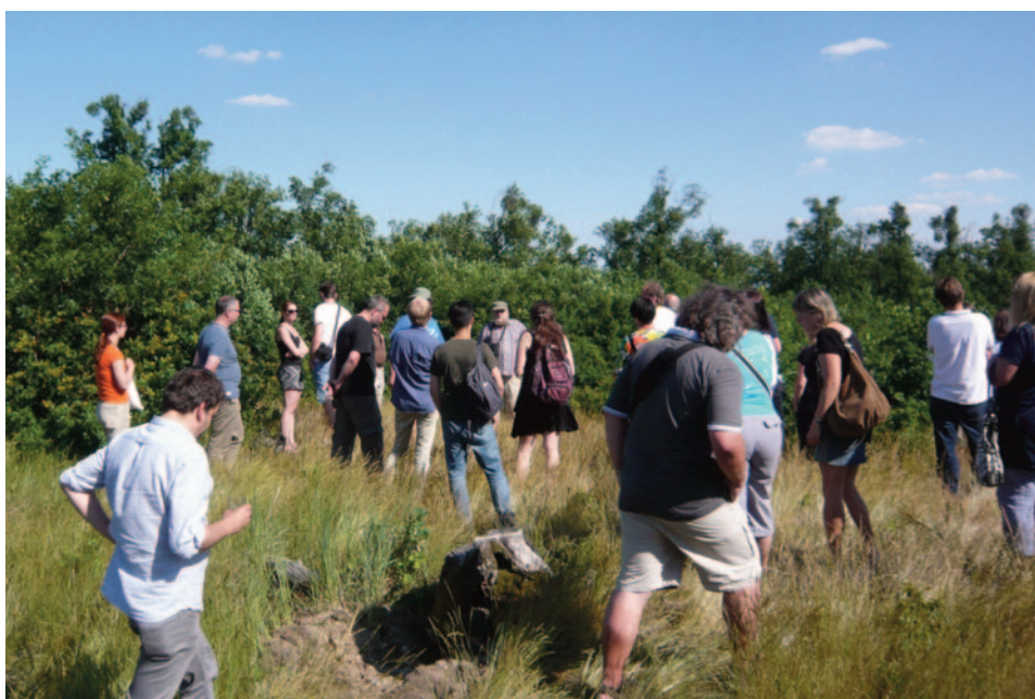
Obr. 43. XLV. seminář – Brno 2017: exkurze – Krumlovský les.