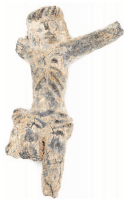
Obr. 12. Unhošť. Torzo odpustkového kříže (položka A 723). V rámci skonu byly s tímto křížem spojeny odpustky pro umírajícího. Proto byl také kříž následně uložen s nebožtíkem do hrobu.

U rubové strany se s vysokou pravděpodobností jedná o vyobrazení svatého Antonína z Padovy s Ježíškem na ruce. Pro stav předmětu ale toto určení není možné jednoznačně doložit ( obr. 11 ). Opis je zachován pouze v náznaku. Na základě celkového provedení lze položku datovat na přelom 18. a 19. století.