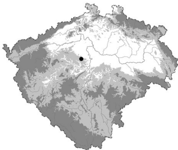
Obr. 1a. Unhošť, okr. Kladno. Poloha lokality na mapě Čech.

Skutečnost, že v minulosti na území sledovaného katastru nebyl učiněn dostatečně významný objev, který by vzbudil zvýšený zájem odborné veřejnosti, má za následek dosavadní nízkou úroveň poznání o historickém vývoji lo-