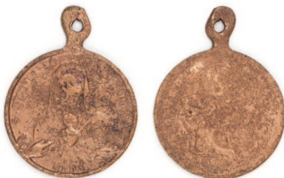
Obr. 10. Unhošť. Do kategorie propagačních medailek je možné zařadit i položku A 734 s vyobrazením Neposkvrněného Srdce Panny Marie na jedné a pravděpodobně sv. Antonína Paduánského na straně druhé.

domě Monte Celio v Římě. Roku 577 jej papež Benedikt I. pověřil prací s římskou chudinou. Roku 579 jej papež Pelagius II. jmenoval svým legátem u císařského dvora v Konstantinopoli, odkud se vrátil roku 586. Poté působil jako jáhen v papežské kanceláři (blíže k Řehořově životní dráze Rendina 2005 , 117–119). Tato položka je datovatelná do 18. století.