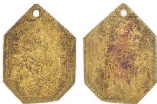
Obr. 4. Unhošť. Poutní svátostka ze Staré Boleslavi (položka A 722) s vyobrazením staroboleslavského Palladia na jedné a sv. Václava na druhé straně.

První položka (inv. č. A 722) je poutní ražená svátostka s vyobrazením Panny Marie Staroboleslavské na jedné a svatého Václava na druhé straně (obr. 4). Obdobnou svátostku zná Přibíl (1931, 61, pol. 219).