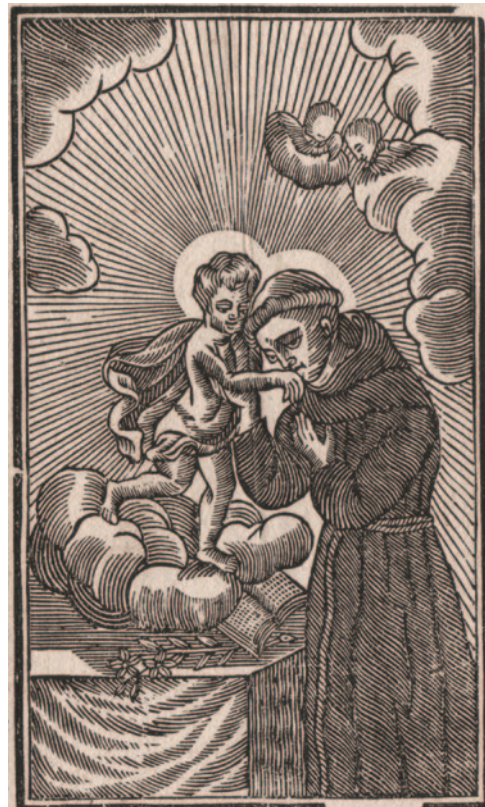
Obr. 11. Rytina sv. Antonína Paduánského z konce 18. století.

Poslední medailka ( obr. 10 ) ze souboru (inv. č. A 734) nese na lícové straně vyobrazení Neposkvrněného Srdce Panny Marie, které je předmětem kultu jak u římskokatolické, tak řeckokatolické církve. Kult přímo navazuje na učení o Neposkvrněném početí Panny Marie. Katolická církev poukazuje na Mariino neposkvrněné srdce jako na jeden ze způsobů, jakým je z jejího hlediska možné vysvětlit její výjimečné postavení v dějinách spásy. Podle učení o Neposkvrněném početí Panny Marie byla Maria uchráněna dědičného hříchu. Vzhledem k tomu, že v křesťanské teologii je dědičný hřích chápán jako příčina hříšnosti každého člověka, katolické učení z toho dovozuje, že Maria byla uchráněna jakéhokoliv hříchu