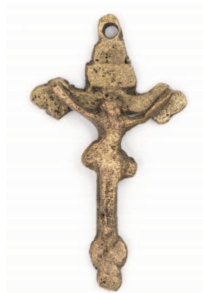
Obr. 13. Unhošť. Mosazný credo-kříž (položka A 724). Na růženci tyto kříže symbolizují modlitbu Credo.

Naopak u precizněji provedených kusů odpustkových křížů z hrobových kontextů lze předpokládat, že mohlo jít o krucifixy z domácího inventáře zemřelých, např. o krucifixy, které si lidé zavěšovali na stěny svých příbytků a kterých jako pohřebních bylo užito z důvodu nutnosti nebo osobní vazby zemřelého k předmětu (blíže Omelka – Řebounová – Šlancarová 2009 ). Torzo lze datovat do 2. poloviny 18. století.