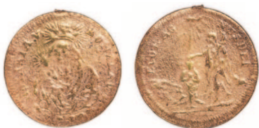
Obr. 6. Unhošť (položka A 732). Křestní symbolika se v nálezích z novověkých hřbitovních areálů nachází ojediněle. Můžeme předpokládat, že vzhledem k umístění Palladia na jedné straně předmětu, byla medailka nabyvatelem získána v souvislosti s poutí do Staré Boleslavi.

U druhé medailky (inv. č. A 732) se jedná o drobnou křestní medaili z přelomu 18. a 19. století s vyobrazením Panny Marie Staroboleslavské na jedné a výjevem křtu Ježíše Krista na druhé straně ( obr. 6 ). Příbil uvádí obdobný líc, jaký je u popisovaného předmětu (vyobrazení Panny Marie Staroboleslavské), u svátostky 273 ze svého soupisu ( Příbil 1931, položka 273, str. 67 ).