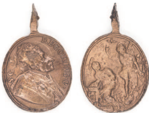
Obr. 8. Unhošť. Položka A 733 s výjevem Zvěstování Panny Marie a s vyobrazením sv. Řehoře I. Velikého je ukázkou katolické propagační medailky z období baroka.

Obr. 9. Obdobné členění výjevu Zvěstování si lze prohlédnout na obraze datovaném do doby po roce 1530 ze sbírek Českého muzea stříbra v Kutné Hoře ( https://www.cms-kh.cz/zvestovani-panny-marie-prirustkove-cislo-43579 ).