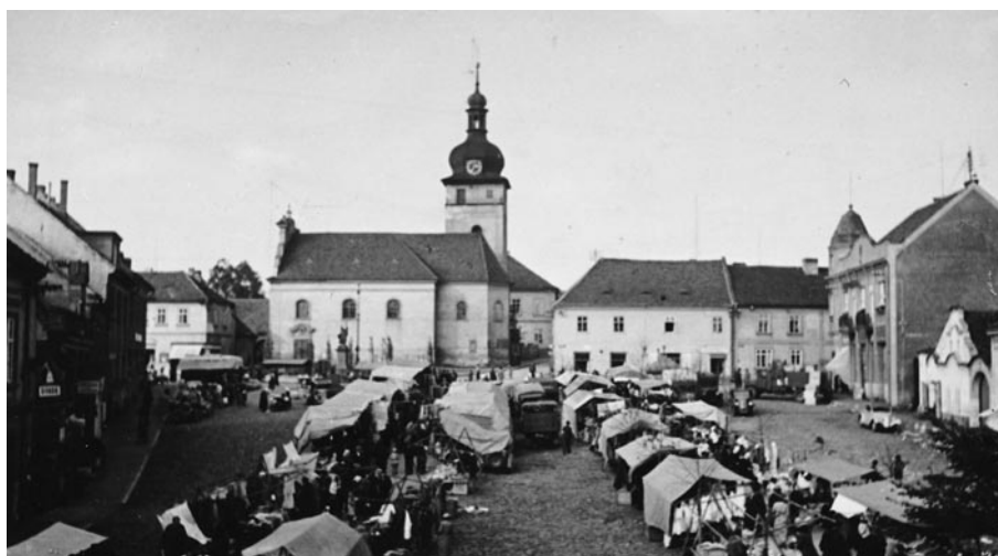
Obr. 3. Unhošť. Dobové foto chrámu sv. Petra a Pavla z fondů Melicharova vlastivědného muzea (1938).

Stejně jako u starší hrobové výbavy ani u čtyř zachovalých novověkých medailek a dvou křížů neznáme jejich původní místo uložení na lokalitě. Jedná se pouze o sběrový materiál ze hřbitovního horizontu. K žádnému konkrétnímu pohřbu není možné níže popsané devocionálie přiřadit.