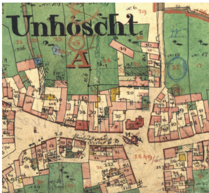
Obr. 1b. Unhošť. Výřez z indikační skici stabilního katastru z roku 1840, k. ú. Unhošť, Rak 365.

Záušnice a čelenky byly vyzvednuty cca 15 m jižně od střední části lodi kostela v prostoru okraje chodníku a sil-