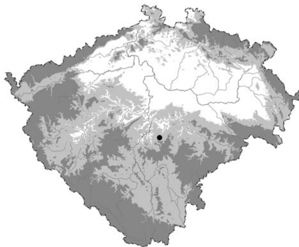
Obr. 1. Vrchotovy Janovice. Poloha lokality na mapě Čech.

Sociální kontext nálezů je však zřejmý. Kachle pocházejí z jádra venkovského vrchnostenského sídla, které pro středověk nedokážeme jednoznačně typově klasifikovat. Svou dispozicí i velikostí se ocitá na pomezí tvrze a hradu ( Durdík 1999, 607–608 ). Nyní se zaměříme hlavně na ikonografické aspekty výzdoby jednoho ze zastoupených motivů, který dosud vzdoroval snahám o dešifrování významu. To je hlavní důvod, proč přednostně (bez detailnějšího vyhodnocení nálezové situace) publikujeme málo početný soubor kachlů. Článek je vzpomínkou na milého člověka, jehož obrovské zásluhy na poli výzkumu historického kamnářství není třeba rozvádět.