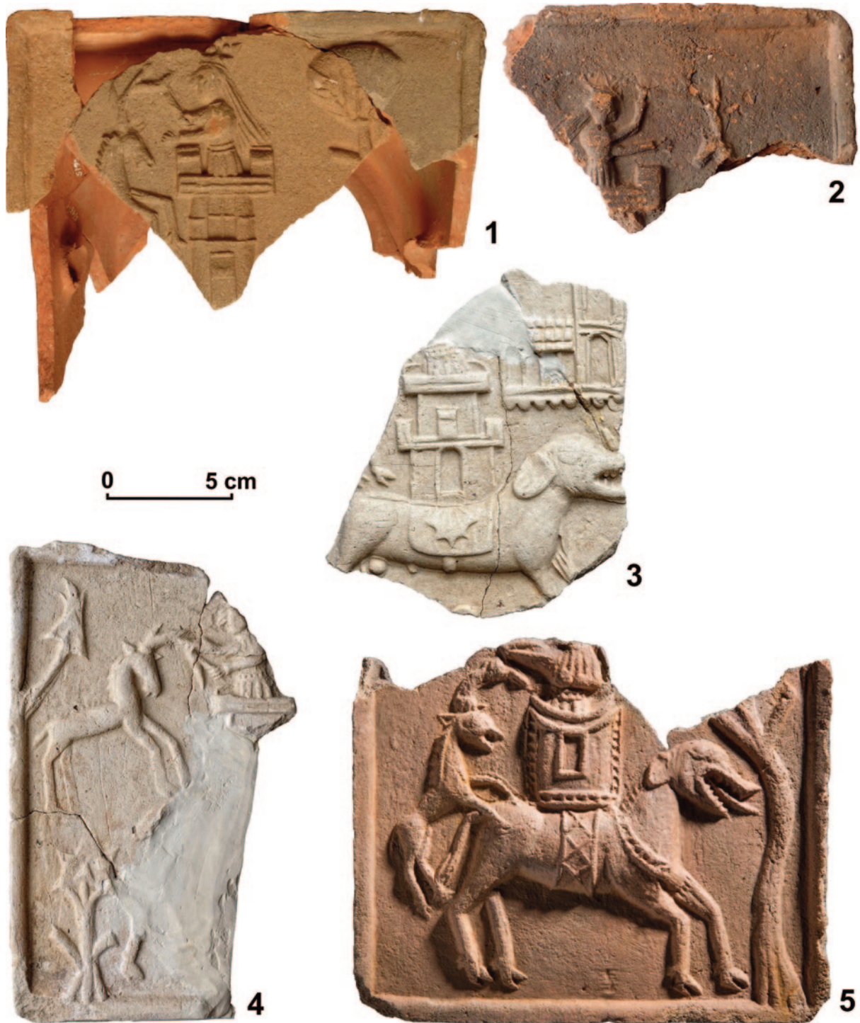
Obr. 3. Zlomky gotických kachlů s motivem ženy ve věži na hřbetu slona; 1 – Sedlčany (Městské muzeum Sedlčany; foto Z. Neustupný), 2 – Vrchotovy Janovice, zámek (Národní muzeum; foto K. Fleková), 3–4 – Lipnice, hrad (Národní památkový ústav, státní hrad Lipnice; foto Z. Neustupný), 5 – Slavětín (Oblastní muzeum v Lounech; foto M. Žihla).

Na relativně větším zlomku, pocházejícím z kachle se čtvercovou vyhřívací stěnou, se dochovala část motivu, který podle těsných analogií dokážeme kompletně rekonstruovat. Na janovickém zlomku rozpoznáváme korunovanou ženskou postavu, jejíž nohy jsou z větší části zakryty cimbuřím (obr. 2:2). Žena se obrací k jelenovitému zvířeti a jednou rukou drží jeho paroh, jenž je k ní nepřírozeně obloukovitě