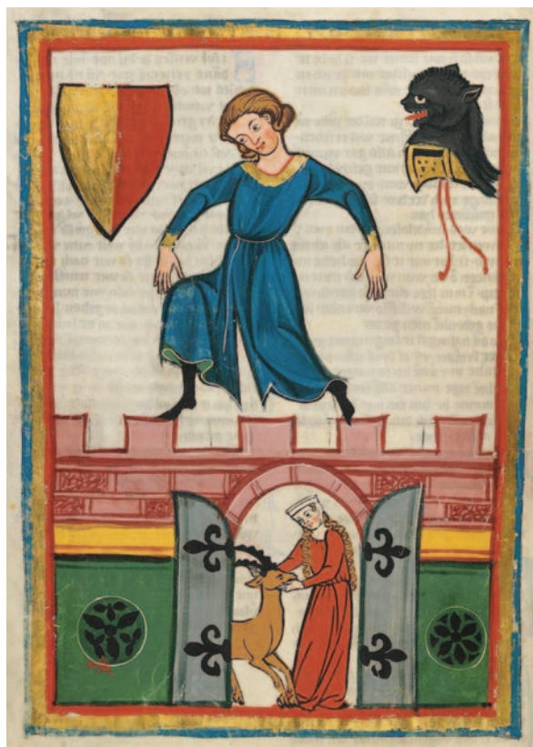
Obr. 4. Stylizovaný portrét minesengra v Codexu Manesse. První polovina 14. století (Universitätsbibliothek Heidelberg; zdroj: www.ub.uni-heidelberg.de ).

Obr. 5. Výjevy dam v rolích krotitelek a ochránkyň fantaskních zvířat na závěsném textilním obraze porýnské proveniencí. Počátek 15. století, výřezy (Historisches Museum Basel; repro: Rapp Buri – Stuckly-Schürer 1990 , 112, 115).