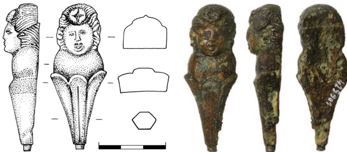
Obr. 2. Bronzová aplika z Vrbové Lhoty, okr. Nymburk. Kresba. A. Waldhauserová, foto Z. Beneš.

Frontální část apliky je tvarovaná do lidské/dětské busty vycházející ze stylizovaného trojlístého kalichu. Rubová strana je hladká, pouze na úrovni hlavičky můžeme pozorovat nenápadný horizontální schůdek, související patrně s upevněním plastiky. Umělecké pojetí plastiky je spíše hrubšího rázu, je zde zřetelná stylizace a zjednodušení anatomických prvků. Pozornost výrobce byla zaměřena na účes, kde můžeme spatřit detailně provedené prameny vlasů, ovšem ani zde se autor nevyvaroval ornamentální stylizace účesu. Prameny vlasů jsou vyčesány dozadu a nahoru, kde vytvářejí drdol rozdělený křížem do čtyř částí. Obličejová část je oválná, vyznačuje se stylizací rysů bez výrazné modelace. Ústa a oči jsou drobné, nevýrazné, oproti tomu je brada těžší, výraznější a mírně vystupuje. Krk skoro chybí, hlava sedí přímo na oblém stylizovaném trupu, který postrádá jakoukoli anatomickou modelaci. Trup plastiky je zasazen do stylizovaného trojlístého kalichu, který je na spodním konci ukončen nezřetelným knoflíkovitým výběžkem ( obr. 2 ). Rozměry: výška 6,6 cm, šířka 2,35 cm, tloušťka max. 1,6 cm, váha 71 g.