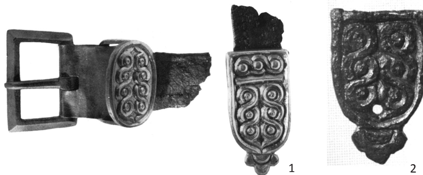
Obr. 4. Přezka a nákončí ze Staré Kouřimi (1) a fragment nákončí ze Žatce (2). Podle M. Šolla a P. Čecha

nákončí jsou mizivé, jeho užívání se může v podstatě překrývat s celou šíří raně středověkého osídlení Hradska.