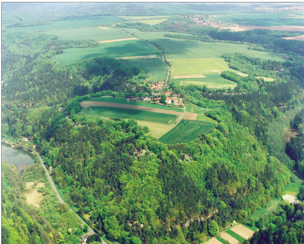
Obr. 2. Hradsko u Mšena.