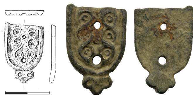
Obr. 3. Hradsko u Mšena. Nákončí opaska. Na fotografiích zvětšeno. Kresba I. Vajglová, foto M. Lutovský

Nákončí opaska bylo zhotoveno v 9. století, kam lze – na základě asi nejznámější analogie z hrobu č. 120 na Staré Kouřimi (obr. 4:1; Solle 1966, 69–73, 269–270, tab. XXV) – s jistotou datovat jeho výrobu a import do Čech. Předmět totiž patrně patří, byť s určitou rezervou, k franským výrobkům (souhrnně k nim Profantová 2011, k předmětnému typu kování s. 79 a obr. 9 na s. 87). Na druhou stranu nedovoluje ovšem stav dochování našeho exempláře ani jednoznačné odmítnutí domácí výroby jakožto napodobeniny honosného importovaného zboží. Oproti staro-