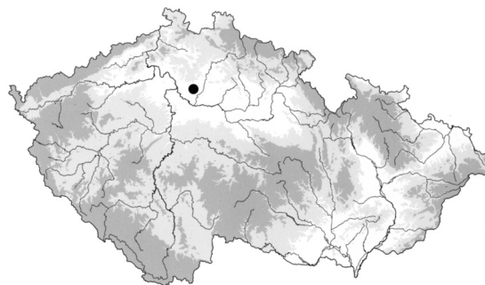
Obr. 1. Slivínko. Poloha lokality na mapě ČR

Doložený počet 17 skleněných náramků ze Slivínka 2 (a další z polohy Slivínko 3), třetí nejvyšší z jedné lokality v Čechách, znovu zaostruje archeologický pohled na strukturu keltského osídlení, kde v době posledního dvacetiletí, po intenzivní prospekci všeho druhu, máme co činit s mimořádnými sídly s málo objasněným zdrojem výskytu těchto skleněných předmětů. Sotva jde o mezeru v soustavné prospekci, neboť amatérský archeolog Tomáš Gajdoš věnoval téměř stejnou pozornost i jiným latěnským sídlištím.