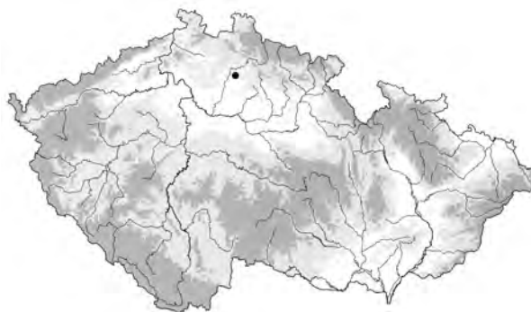
Obr. 1. Suhrovic, okr. Mladá Boleslav. Poloha lokality na mapě ČR

Jehlice v kontextu lužických popelnicových polí bývá považována za osobní výbavu ke spí-