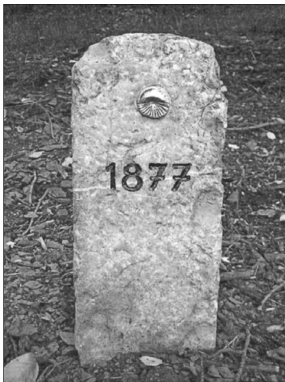
Obr. 5. Stradonice – nový pomníček na Hradišti