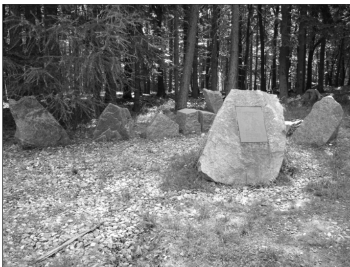
Obr. 17. Komorsko – skupina balvanů, připomínající nedaleké místo zaniklé středověké vesnice (foto autor 2013)

Jestliže oprávněně považujeme i povrchový průzkum za formu archeologického výzkumu, musíme připojit ještě zmínku o celkem nedávno, kolem roku 2000 osazené půlkruhové skupině balvanů na rozcestí lesních silniček u hájovny Komorsko v Brdech nad Jinci, z nichž největší nese reliéfní tabulku s plánkem zjištěné situace zaniklé středověké vesnice (obr. 17 a 18). Tabulku opatřil podnik Lesy ČR a zachycuje poznatky o vesnici Komorsko, zaniklé v 15. století v nevelké vzdálenosti odtud, jak je v roce 1994 konstatoval průzkum K. Nováčka (Nováček 1995, 12–22).