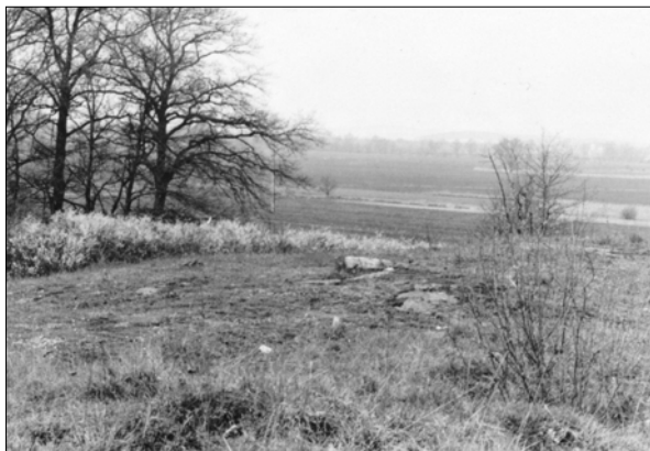
Obr. 13. Putim – místo nálezu mezolitických výrobních míst pod Pikarnou (1949)