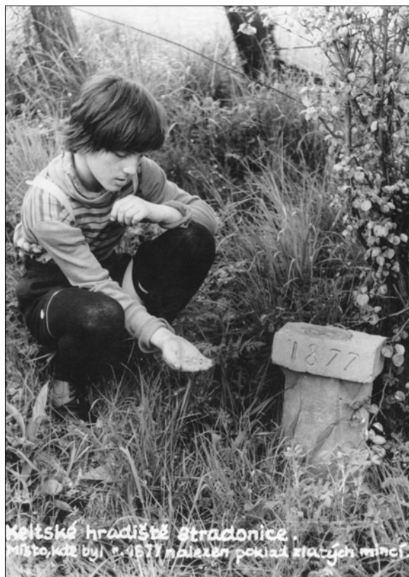
Obr. 4. Stradonice – původní pomníček na Hradišti (1979)