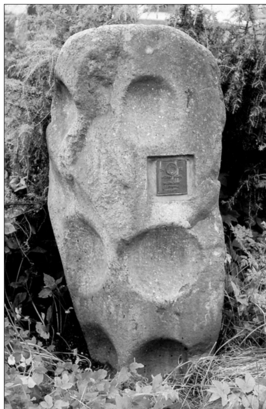
Obr. 12. Rejštejň – stouповý kámen

Pamětní kámen uvedl do literatury písecký archeolog a muzejník Jiří Fröhlich (Fröhlich 1971, 235–236; týž 2006, 42), jemuž děkuji za upozornění a informace.