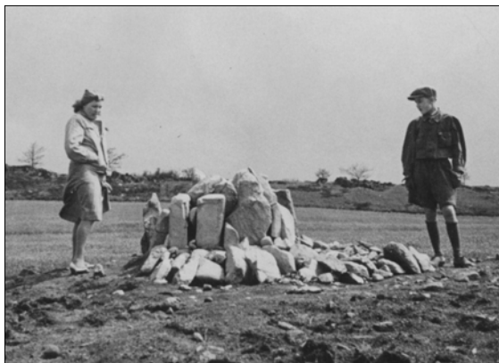
Obr. 14. Putim – dva snímky čerstvě zřízovaného pomníčku výzkumu pod Pikarnou (z pozůstalosti B. Dubského, 1949 či 1950)