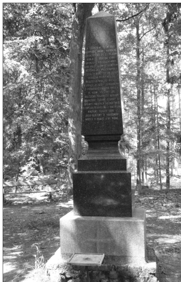
Obr. 7. Velká Dobrá – detail stély pomníku (foto autor 2011)