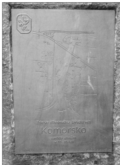
Obr. 18. Komorsko – detail desky s reliéfním plánkem pozůstatků vesnice