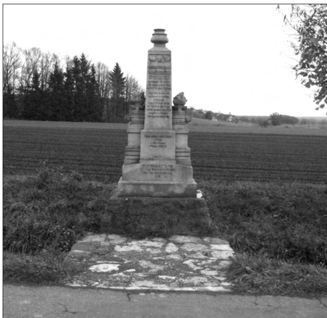
Obr. 11. Třebesov – pomník v současné podobě

Kamenný pomník se sošpturou popelnice na vrcholku, postavený z dobrovolných příspěvků obce Třebesova, okolních obcí, hradeckého muzea i soukromníků (obr. 9 a 10) a odhalený již 20. 8. 1911 (dílo sochaře Bažanta z Rychnova nad Kněžnou) 11 rovněž stojí dosud na původním místě, donedávna ovšem zarostlý ve stromoví tak, že téměř nebyl vidět. Dnes jsou náletové dřeviny odstraněny a pomník je opět dobře viditelný (obr. 11).