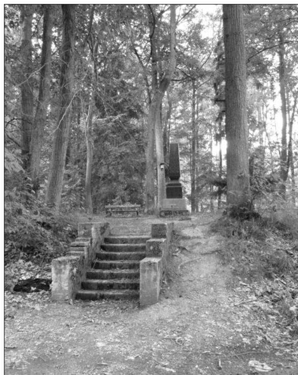
Obr. 6. Velká Dobrá – celková úprava pomníku zřízeného na největší z dochovaných mohyl

Návrší Pičhora u Dobřichova (okr. Kolín) je v české archeologii pojmem ještě mnohem významnějším: spolu s žárovým pohřebištěm na sousedícím návrší zvaném Třebická (1891) podalo pohřebiště na Pičhoře poprvé a hned v mimořádné dokonalosti obraz kultury germánského osídlení Čech v době římského císařství (v první polovině 1. tisíciletí po Kr.), o níž dosud nebylo známo takřka nic. 9 Bohatá výbava z více než 130 hrobů, včetně vzácných importů z římských dílen a provincií, patřila ke špičkovým exponátům první velké expozice českého pravěku