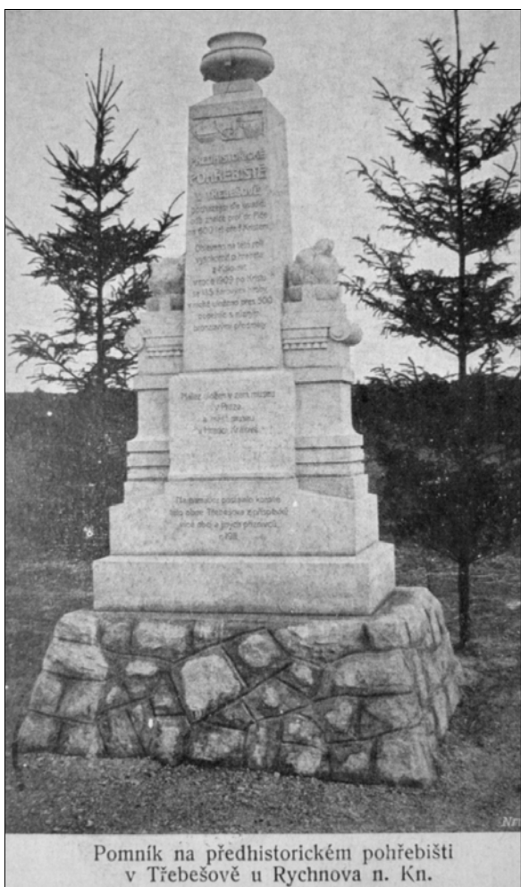
Pomník na předhistorickém pohřebišti v Třebešově u Rychnova n. Kn.