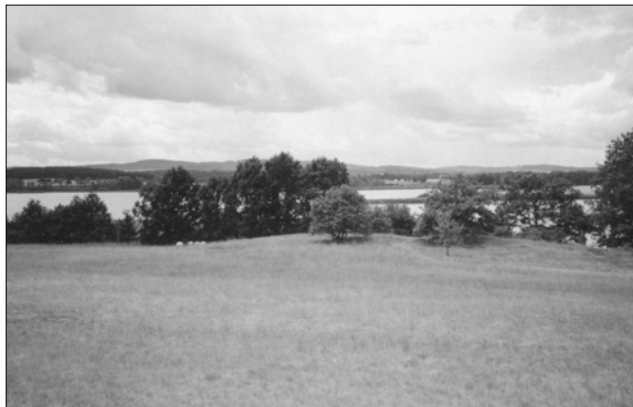
Obr. 16. Putim – celek naleziště po zániku „pomníku“ (foto autor 1978)