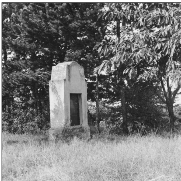
Obr. 8. Dobřichov – pomník na Pičchoře