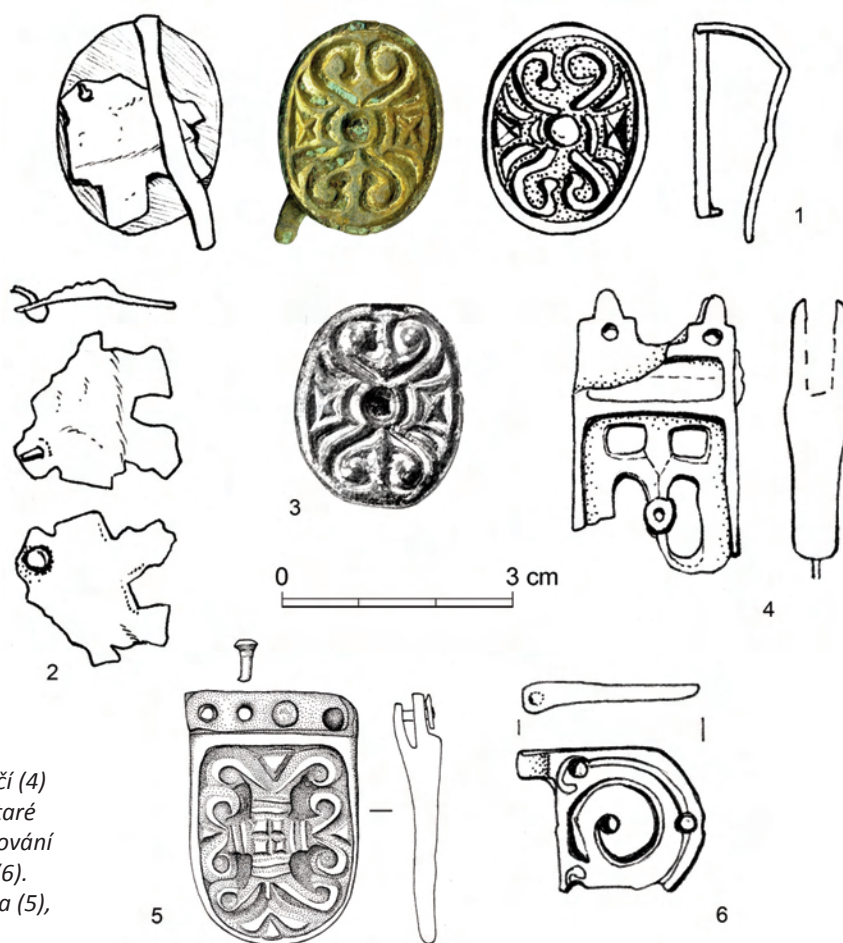
Obr. 2. Průvlečka (1, 2) a nákončí (4) z Kosiček a jejich analogie (3 Staré Město, hrob 114/51, 5 Bojná). Kování z Libčan, okr. Hradec Králové (6). Podle V. Hrubého (3) a V. Turčana (5), ostatní – kresba L. Raslová