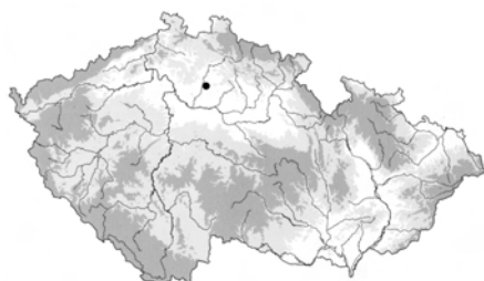
Obr. 1. Nepřevázka, okr. Mladá Boleslav. Mapa s vyznačením místa nálezu depotu. Vlevo: poloha lokality na mapě ČR

Obě zlaté ozdoby ležely v hloubce 20 cm od dnešního povrchu, vzdáleny od sebe 95 cm. Po revizi náleзовých okolností lze vyloučit, že by byly nalezeny in situ v hrobě či sídlištním objektu. Naopak je pravděpodobné, že byly transportovány (max. v řádu metrů) v důsledku eroze jílovitého podloží svahu (rozsáhlé svahové eroze jsou obecně známy po celém hřbetu Chlumu a dokonce jsou zachyceny v ústní tradici v pověsti o propadlém městě). Okolí nálezu bylo podrobeno průzkumu pulsním detektorem, k dalším nálezům však již nedošlo.