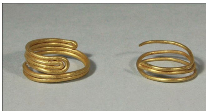
Obr. 3. Depot zlata únětické kultury z Nepřevázky.

Na základě podílu stříbra ve zlatých předmětech únětické kultury jsou u nás pozorovány dvě skupiny. První s obsahem stříbra kolem 25 % a druhá, jejíž obsah stříbra se pohybuje kolem 11 %. Námi zpracovávaný nález tedy patří do druhé skupiny a můžeme ještě uvést, že se nejedná o zlato získané rýžováním, které obsahuje podíl stříbra méně než 4 % ( Jiráň ed. 2008, 62 ).