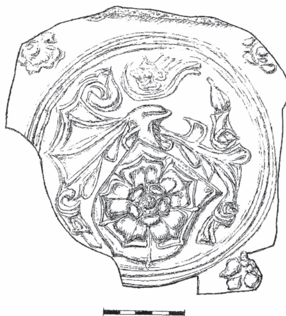
Obr. 4. Bechyně, hrad a zámek. Pozdně gotický kachlový reliéf – erb se znamením růže Rožmberské nebo Hradecké větve Vítkovců (foto a rekonstrukční kresba)