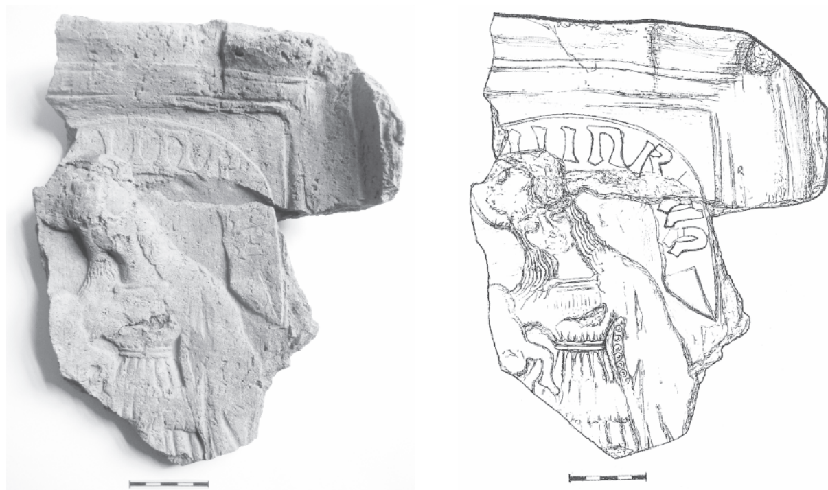
Obr. 3. Bechyňe, hrad a zámek. Pozdně gotický kachlový reliéf – Panna Marie s Ježíškem (foto a kresba)

Díky výše uvedeným okolnostem nebyla pro autora tohoto sdělení překvapivá informace o existenci soukromé sbírky pocházející z dané lokality. Nálezce, pocházející z řad pracovníků stavební firmy, potvrdil, že zlomky posbíral během odtěžování terénu v okolí bývalé pozdně gotické bašty, která stála při jihovýchodním nároží dnešního renesančního východního zámeckého křídla (obr. 2:A) a při úpravách v prostoru někdejšího západního parkánu (obr. 2:B). Nevelký, avšak zajímavý soubor tvoří po slepení osm samostatných zlomků čelních reliéfních stěn komorových kachlů. Dva zlomky zdobí náboženská témata (obr. 3 a 5), tři heraldická (obr. 4 a 6:1,2) a na dvou nespojitelných zlomcích je lovecký motiv (obr. 7). Reliéfní výzdobu na jednom zlomku není možné s jistotou identifikovat (obr. 6:3). Soubor dále obsahuje zlomek kachle nádobkového typu (obr. 8) a část hrnce s uchem (obr. 9).