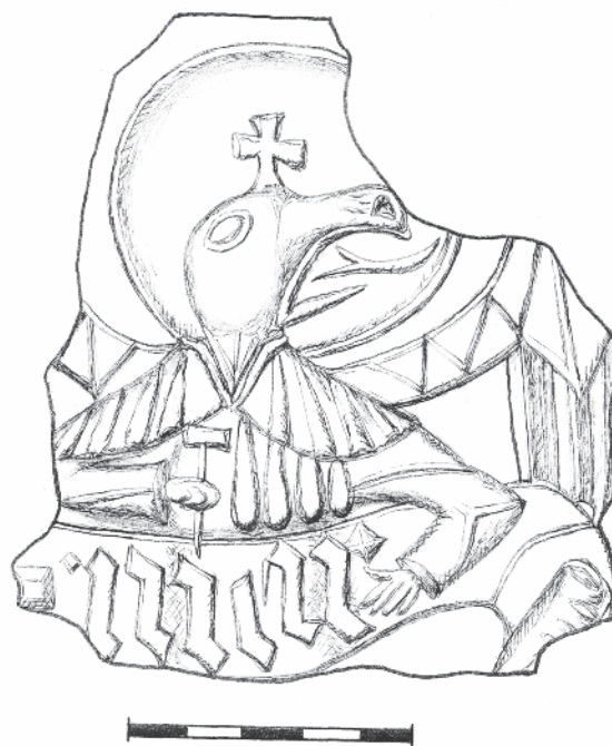
Obr. 5. Bechyně, hrad a zámek. Gotický kachlový reliéf - antropozoomorfní symbol evangelisty Jana (foto a kresba)