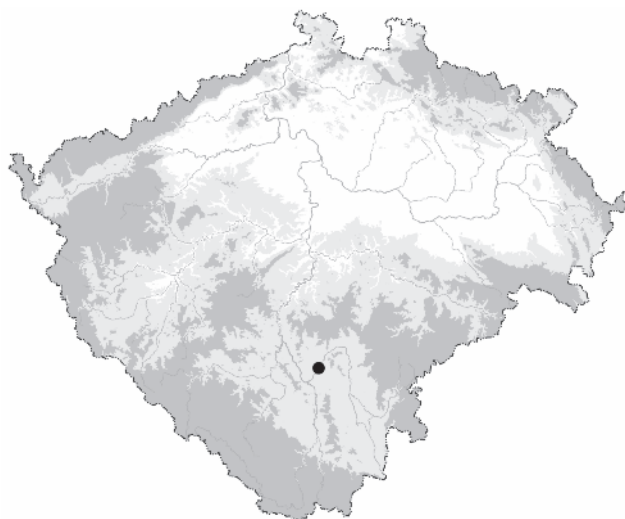
Obr. 1. Bechyně, okr. Tábor. Poloha lokality na mapě ČR

Bechyňský zámek, původně gotický hrad, stojí na skalnaté ostrožně obtékané říčkou Smutnou, která se vlévá do řeky Lužnice. Tyto vodní toky vytvořily v kraji hluboká údolí, která chránila panské sídlo i přilehlé stejnojmenné město ( obr. 1 ). Jihočeskou Bechyni známe již jako raně středověké hradiště, které se později stalo majetkem pražského biskupství. V roce 1268 Bechyni získal král Přemysl Otakar II. a poručil zde založit kamenný hrad. V roce 1340 přešlo bechyňské sídlo s přilehlým městečkem natrvalo do šlechtického držení, konkrétně do rukou pánů ze Šternberka. Během husitských válek katolickou Bechyni v roce 1428 úspěšně oblehli husité. V těchto bouřlivých dobách vlastnili Bechyni různí majitelé, až v roce 1477 se sem opět vrátili Šternberkové pocházející z českých větví, holické i konopištské ( Juřík 2013, 60–62 ). Z jejich popudu došlo mj. na hradě k velkolepým přestavbám obytné i obranné složky. Dodnes můžeme obdivovat např. pozdně gotickou síň se středním sloupem a žebrovou klenbou v podobě uschlého stromu, nebo jižní štítovou zeď, postavenou na ochranu proti ostřelování