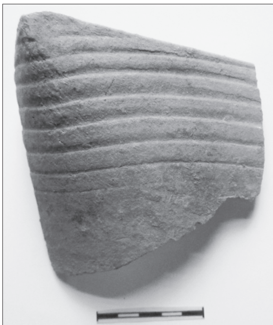
Obr. 8. Bechyně, hrad a zámek. Pozdně gotický nádobkový kachel