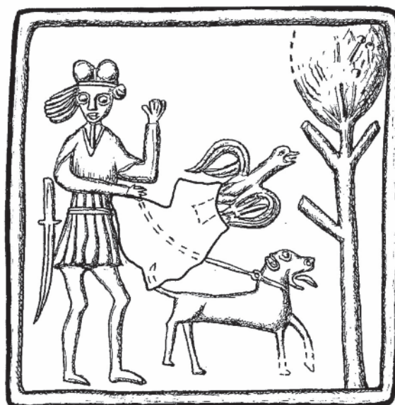
Obr. 7. Bechyně, hrad a zámek. Gotický kachlový reliéf: 1 – lovecká scéna; 2 – celistvá analogie pocházející z Prahy (rekonstrukční kresba)

Zlomek č. 5: Drobné torzo erbu saských Wettinů (obr. 6:1) – OL jednoduchá, hranolová; místo nálezu – západní parkán (obr. 2:B); rozměry – 85 × 90 mm; ČVS komorového reliéfního kachle čtvercového formátu; povrch – režný, na vnitřní straně jsou stopy po nevýrazném, táhlém prstování a drobné vrypy po špachtli, při styku s odlomenou komorou se objevuje slabé zakouření; stěp je oranžově zbarvený, jemný; ostřívo – drobné plátky zlatavé slídy se uplatňují zřídka; reliéf je poměrně nízký; mocnost ČVS je cca 7 mm, ve vystupující okrajové partii však dosahuje až 14 mm; datace – kolem 1500. Popis reliéfu: na zlomku je zbytek buvolích rohů, ozdobených řadami vodorovných tyček s praporky a pod nimi část centrální helmice s korunkou, heraldicky vlevo se objevuje vršek druhého klenotu – klobouku s routou (Wettinský erb má nad štítem zpravidla trojici příleb s třemi různými klenoty), ČVS ve vzdálenosti 25 mm od okraje