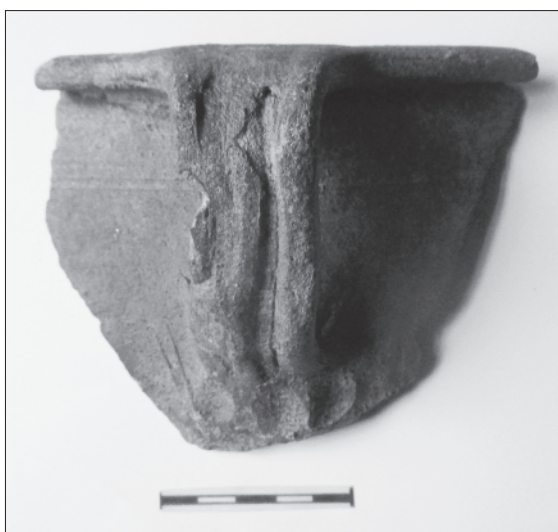
Obr. 9. Bechyně, hrad a zámek. Hrdlo gotické nádoby s uchem. Pokud není uvedeno jinak, kresby a foto Čeněk Pavlík

Další varianta této ikonografie pochází např. ze Sedlčan (Pavlík – Vitanovský 2004, 101, 246, kat. č. 605, 606). Pozn. – zobrazená knížecí čapka je všeobecně spojována se sv. Václavem. Na kachlových reliéfech však analogickou pokrývkou hlavy spatřujeme i na jiných ikonografiích, např. v případě sv. Martina nebo Jana Žižky (Pavlík – Vitanovský 2004, 217, kat. č. 297–303 a 243–244, kat. č. 574, 577).