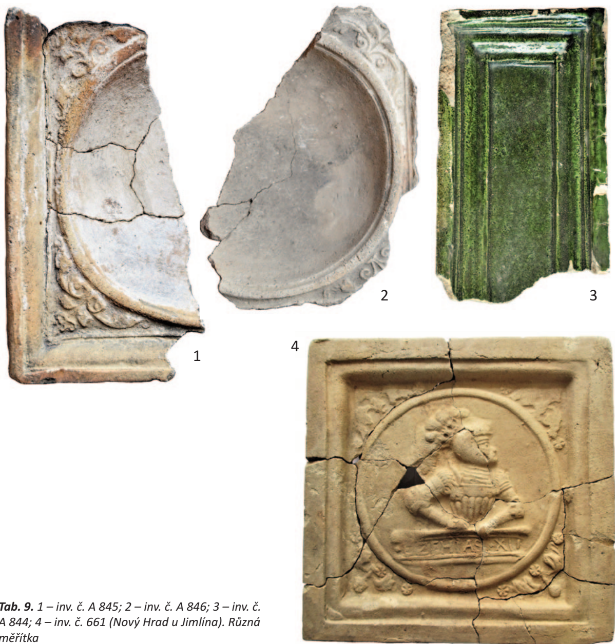
Tab. 9. 1 – inv. č. A 845; 2 – inv. č. A 846; 3 – inv. č. A 844; 4 – inv. č. 661 (Nový Hrad u Jimlína). Různá měřítka

137 × 187 mm; rámové komory hluboké 55 a 66 mm; materiál – jemně plavený, světle hnědý, na vnitřní straně zakouřený; datace – konec 16. století; lokalita – Louny, Mírové náměstí 57; přír. č. 36/96, inv. č. A 850–859.