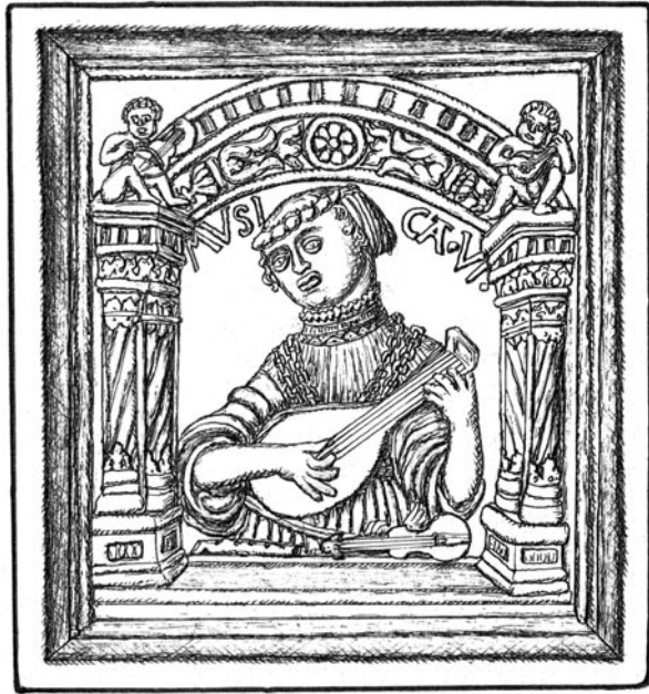
Obr. 4. Alegorie hudby. Radeč u Sedlčan čp. 2 „Spilkův statek“. Kresba Č. Pavlík