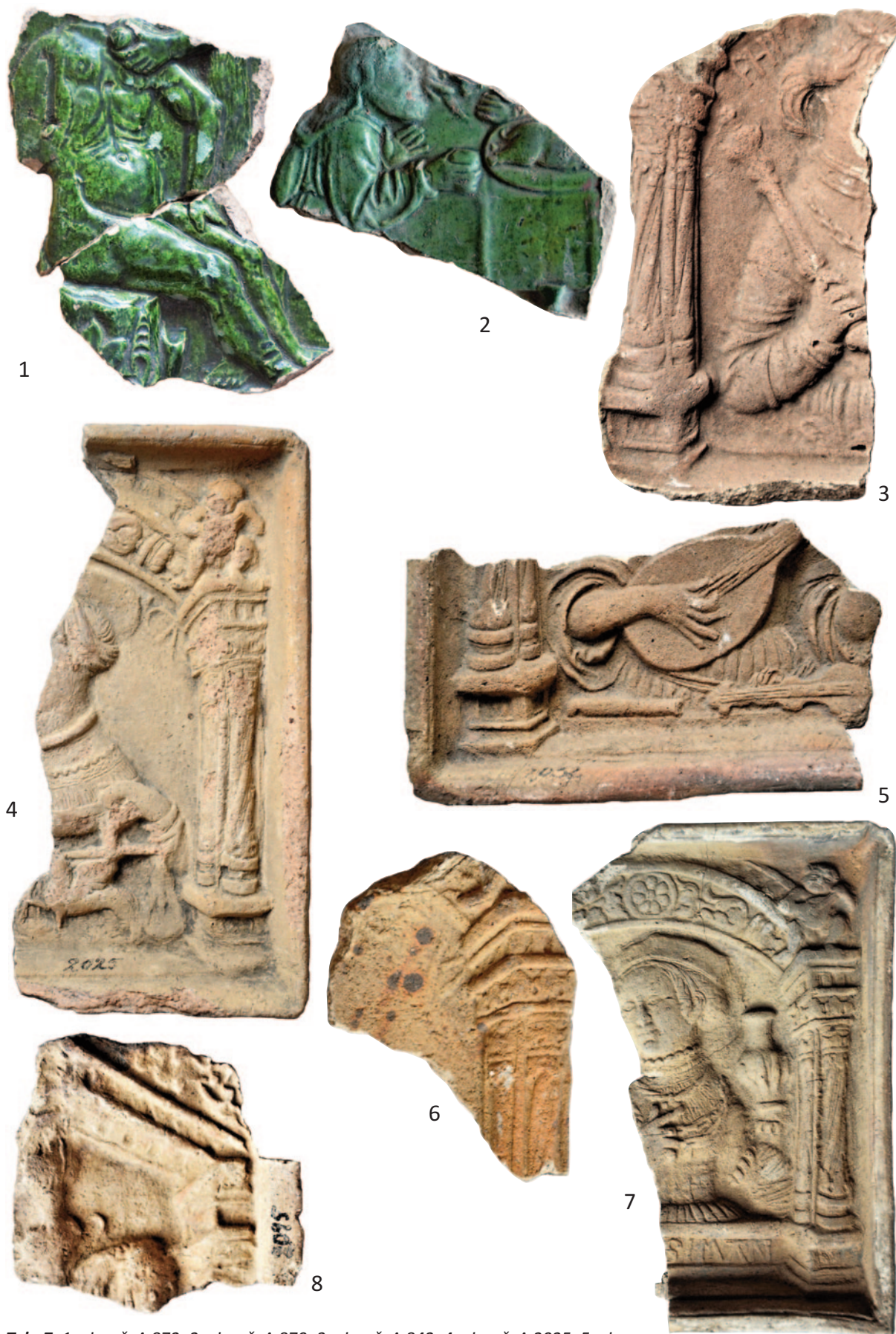
Tab. 7. 1 – inv. č. A 872; 2 – inv. č. A 870; 3 – inv. č. A 842; 4 – inv. č. A 2025; 5 – inv. č. A 2032; 6 – inv. č. A 828; 7 – inv. č. A 873. 8 – inv. č. A 2095. Různá měřítka