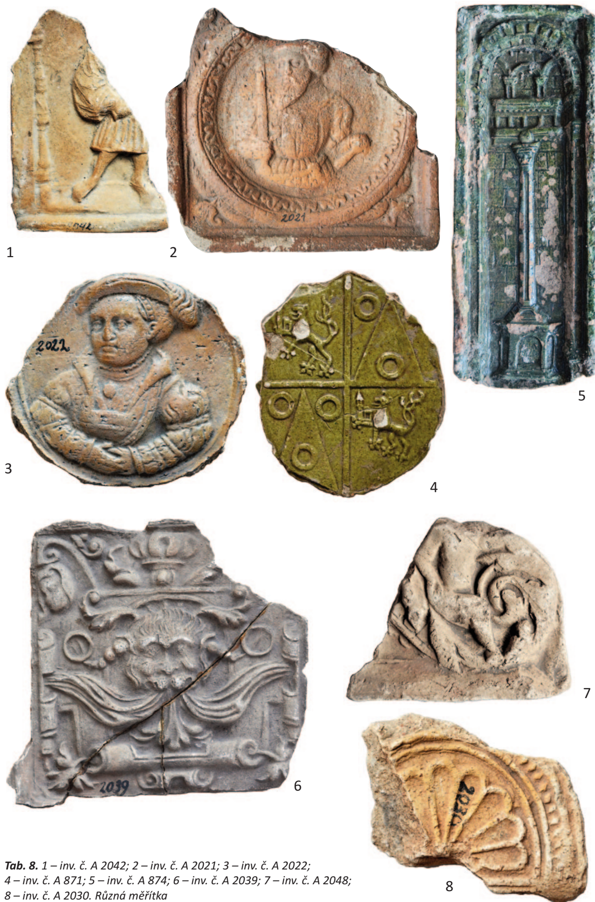
Tab. 8. 1 – inv. č. A 2042; 2 – inv. č. A 2021; 3 – inv. č. A 2022; 4 – inv. č. A 871; 5 – inv. č. A 874; 6 – inv. č. A 2039; 7 – inv. č. A 2048; 8 – inv. č. A 2030. Různá měřítka