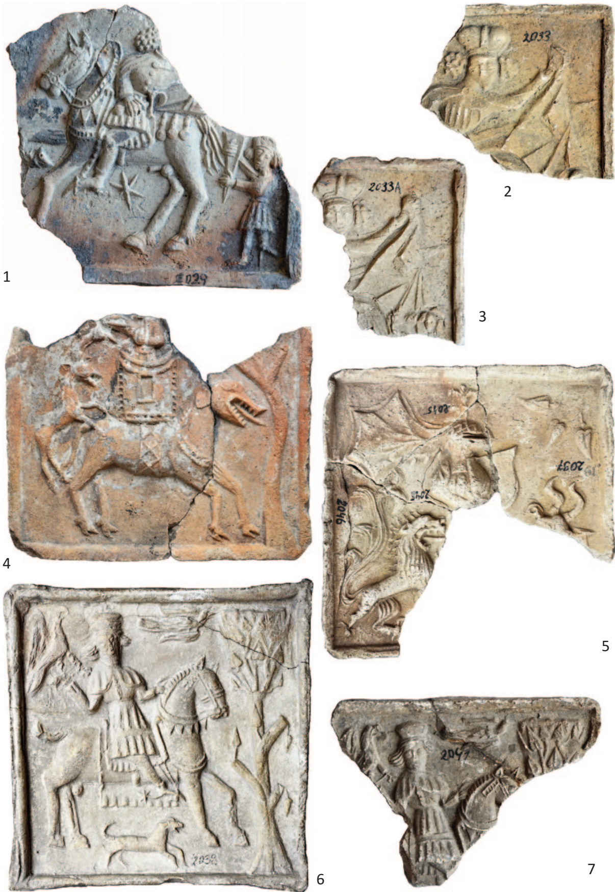
Tab. 3. 1 – inv. č. A 2029; 2 – inv. č. A 2033; 3 – inv. č. A 2033A; 4 – inv. č. A 869; 5 – inv. č. A 2037, 2045, 2046; 6 – inv. č. A 2038; 7 – inv. č. A 2041. Různá měřítka