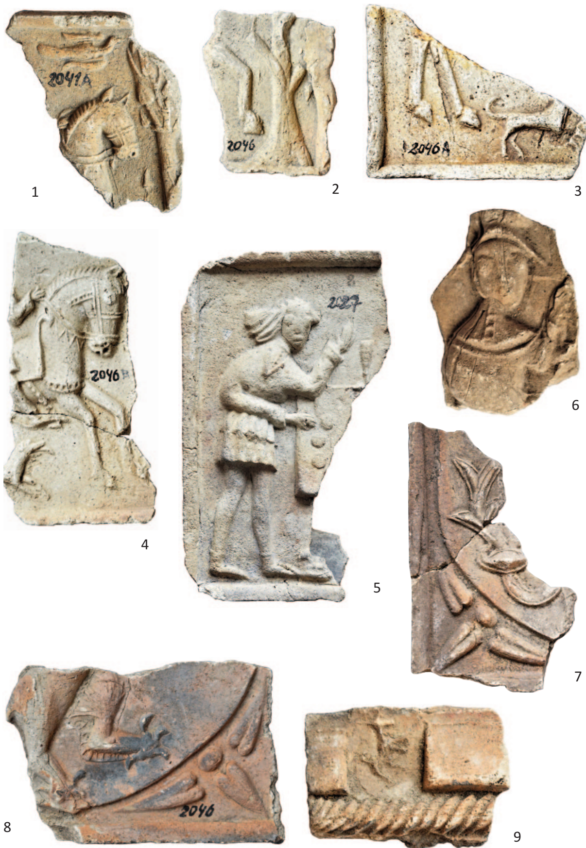
Tab. 4. 1 – inv. č. A 2041A; 2 – inv. č. A 2046; 3 – inv. č. A 2046A; 4 – inv. č. A 2046B; 5 – inv. č. A 2027; 6 – inv. č. A 865; 7 – inv. č. A 2046C; 8 – inv. č. A 830; 9 – inv. č. A 831. Různá měřítka