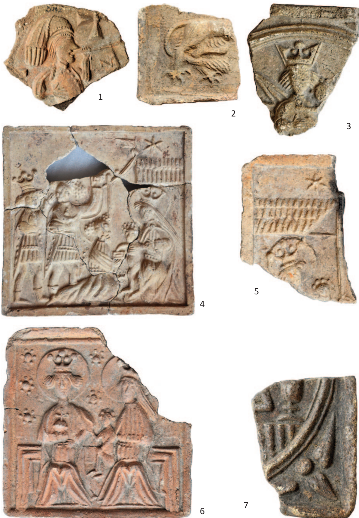
Tab. 1. 1 – inv. č. A 2047; 2 – inv. č. A 829; 3 – inv. č. A 832; 4 – inv. č. A 868; 5 – inv. č. A 840; 6 – inv. č. A 841; 7 – inv. č. A 825. Různá měřítka