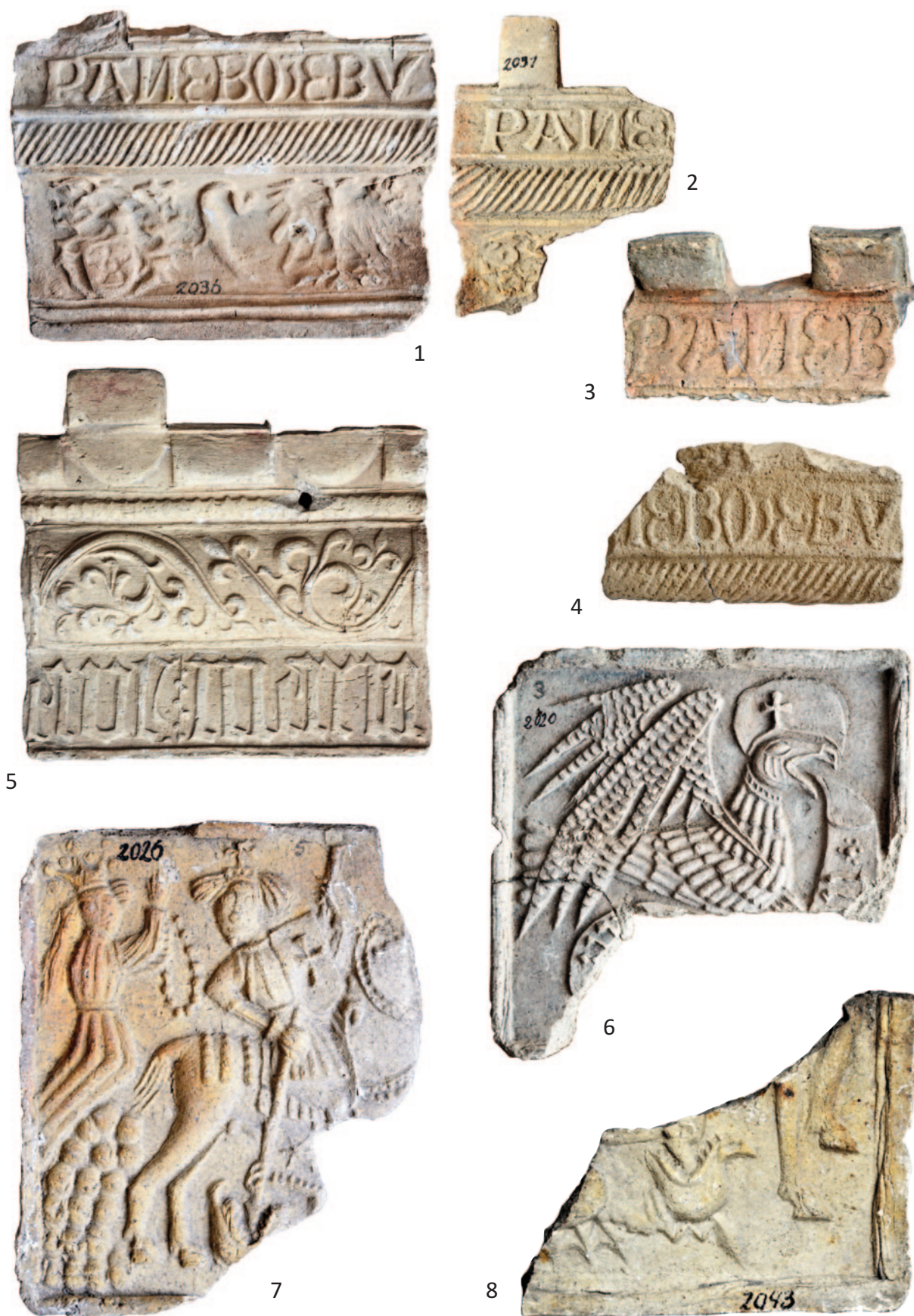
Tab. 2. 1 – inv. č. A 2036; 2 – inv. č. A 2031; 3 – inv. č. A 2031A; 4 – inv. č. A 2031B; 5 – inv. č. A 866; 6 – inv. č. A 2020; 7 – inv. č. A 2026; 8 – inv. č. A 2043. Různá měřítka