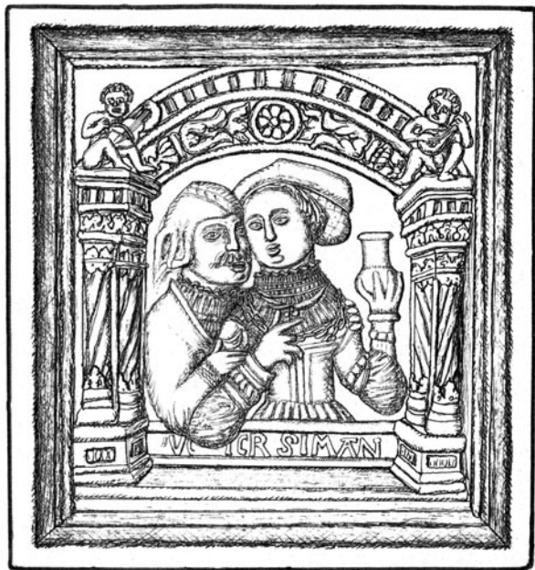
Obr. 5. Rozverný pár. Karlsruhe-Durlach, Saumarkt. Kresba Č. Pavlík