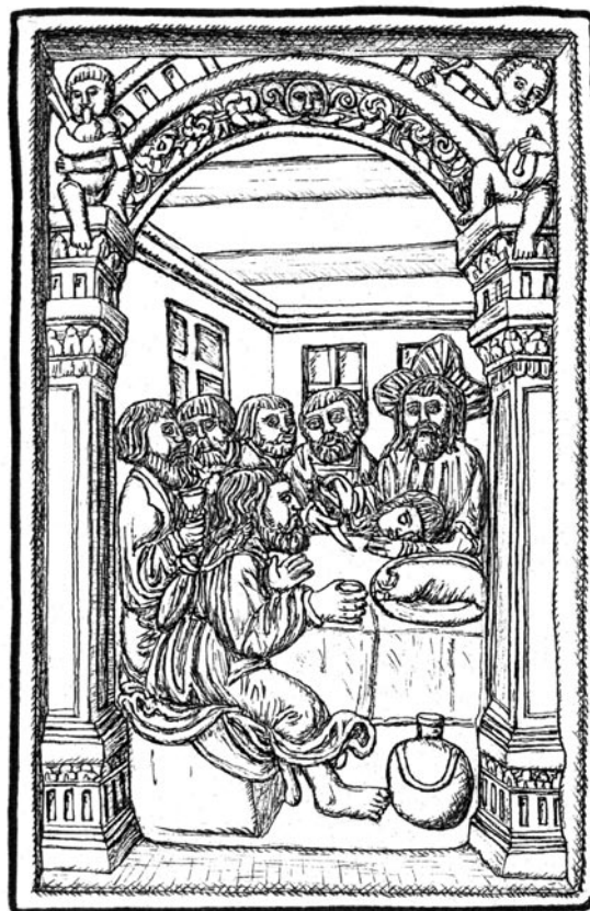
Obr. 3. Poslední večeře, levá část. Otisk formy nalezené v německém Špýru. Kresba Č. Pavlík