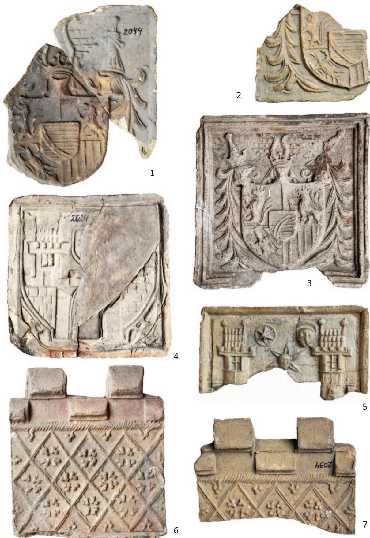
Tab. 5. 1 – inv. č. A 2040, 2044; 2 – inv. č. A 2035; 3 – inv. č. A 867; 4 – inv. č. A 2024; 5 – inv. č. A 2023; 6 – inv. č. A 824; 7 – inv. č. A 2034. Různá měřítka