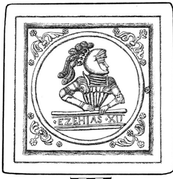
Obr. 6. Ezechias. Nový Hrad u Jimlína, hrad/zámek (rekonstrukce). Kresba Č. Pavlík

Motiv č. 20 – polopostava muže v antikizující zbroji umístěná v medailonu. Cvikly vyplňují květinové motivy, celek obepíná zdvojená lišta. Muž se opírá o náznak balustrády, ve které je umístěn majuskulní nápis „EZECHIAS.XII“ – Ezechiáš (též Chizkijáš) byl dvanáctý judský král (tab. 9:4; obr. 6): typ kachle – zákl., kom., rež.; rozměry ČVS cca 215 × 215 mm, na vnitřní straně se objevuje otisk tkaniny, při okrajích přerušeny táhlým prstováním; hloubka mírně prožlabené rámové komory cca 52 mm, její ústí zpevňuje nevýrazná vnější manžeta o šířce cca 15 mm; materiál – jemně plavený, šedožlutý, místy s nádechem do oranžova, uvnitř stopy po zakouření; datace – konec 16. století; lokalita – Nový Hrad u Jimlína, hrad/zámek; přír. č. 6/2014, inv. č. A 661–672, A 674–682, 686–695. Lit.: Špaček – Pavlík 2014 ; Šreiberová ed. 2017 , 150–151, č. kat. 054e. Pozn.: Reliéf byl vytvořen podle norimberské rytiny Georga Pencze z roku 1531 ( Břicháček – Hereit 1996 ). Analogické reliéfy s prorokem Ezechielem, ovšem s jiným rámováním, známe např. z Prahy ( Brych – Stehlíková – Žegklitz 1990 , 109, kat. č. 252) nebo z Brna ( Loskotová 2012 , 675, obr. 9, kat. č. 7).