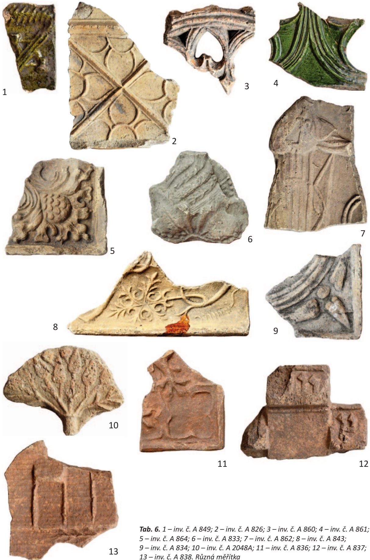
Tab. 6. 1 – inv. č. A 849; 2 – inv. č. A 826; 3 – inv. č. A 860; 4 – inv. č. A 861; 5 – inv. č. A 864; 6 – inv. č. A 833; 7 – inv. č. A 862; 8 – inv. č. A 843; 9 – inv. č. A 834; 10 – inv. č. A 2048A; 11 – inv. č. A 836; 12 – inv. č. A 837; 13 – inv. č. A 838. Různá měřítka