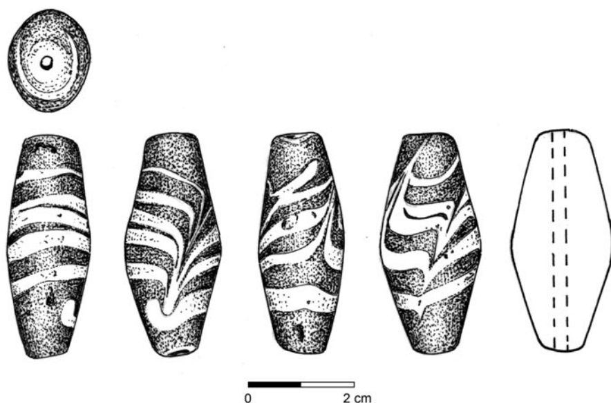
Obr. 1. Praha-Stodůlky (?). Skleněný korál ze sbírky Emanuela Štěpána Bergera. Kresba M. Fábiková, grafická úprava M. Kafka

Typologicko-chronologický komentář: Skleněný artefakt náleží do skupiny cylindrických korálů a v jejím rámci k řídkému typu s výzdobou nepravidelným cik-cak vzorem (Koch 2011, 71–72, Abb. 38–39). Tyto korály pocházejí ze šesti lokalit střední Itálie, podle hrobových celků z pohřebišť Osteria dell’Osa, Veji a Pontecagnano se jejich datování pohybuje mezi druhou polovinou 9. století př. n. l. a třetí čtvrtinou 8. století př. n. l. Kromě střední Itálie jsou ovšem známy také z prostoru východního Středomoří – z Egeidy a Levanty (Koch 2011, 71, Abb. 39). Jejich provenience z hlediska míst(a) výroby tudíž není zcela jasná. Je ovšem zřejmé, že pokud je stodůlecký nález autentický, představuje import ze Středomoří.