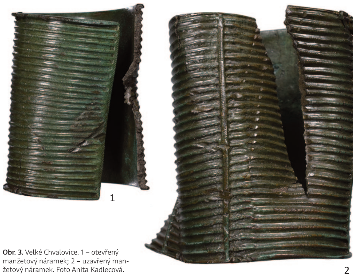
Obr. 3. Velké Chvalovice. 1 – otevřený manžetový náramek; 2 – uzavřený manžetový náramek.

223). Tyto náramky jsou známy především z únětického pohřebiště zkoumaného Janem Felcmanem v roce 1903, které se nacházelo cca 400 m severoseverovýchodně od okraje obce Tursko (okr. Praha-západ), kde byly také nalezeny v páru (Vykouková et al. 2007, 205, 209). Z depotů doposud nebyly tyto uzavřené manžetové náramky známy (Moucha 2005, 57), což se však změnilo s nedávno objeveným depotem z Turska, kde se mimo mnoha dalších předmětů vyskytl také pár uzavřených manžetových náramků. 2 Nález z Velkých Chvalovic představuje při srovnání s obdobnými náramky z Turska-Těšiny (Vykouková et al. 2007, 211) patrně prozatím nejdelší a nejtěžší exemplář, jaký byl na území Čech nalezen.