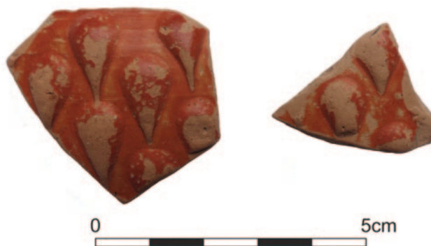
Obr. 1. Jevíčko XIII (okr. Svitavy, Pardubický kraj), sídliště, obj. 10 (chata II). Římská jemná keramika s barbotinovými kapekami.

Dva fragmenty zdobené výdutě barbotinové keramiky pocházejí z jedné nádoby – poháru. Větší fragment: jemná žluto-oranžová hlína a matná oranžově-červená barva potahu, 7 prvků ve tvaru barbotinových kapek, z toho 5 úplných (d. 1,6 cm), částečně oprýskané, š. 0,4–0,5 cm. Menší fragment: jemná žluto-oranžová hlína a matná oranžově-červená barva potahu, 5 neúplných prvků ve tvaru barbotinových kapek, oprýskané, š. 0,4 cm. Oranžově-červený potah byl u obou zlomků vně i uvnitř. U většího fragmentu jsou makroskopicky pozorovatelné malé částice vápence, z toho jeden větší uvnitř výdutě. Nálezy, jakož i veškeré další artefakty z výzkumu lokality Jevíčko XIII, budou uloženy v Muzeu regionu Boskovicka v Boskovicích.