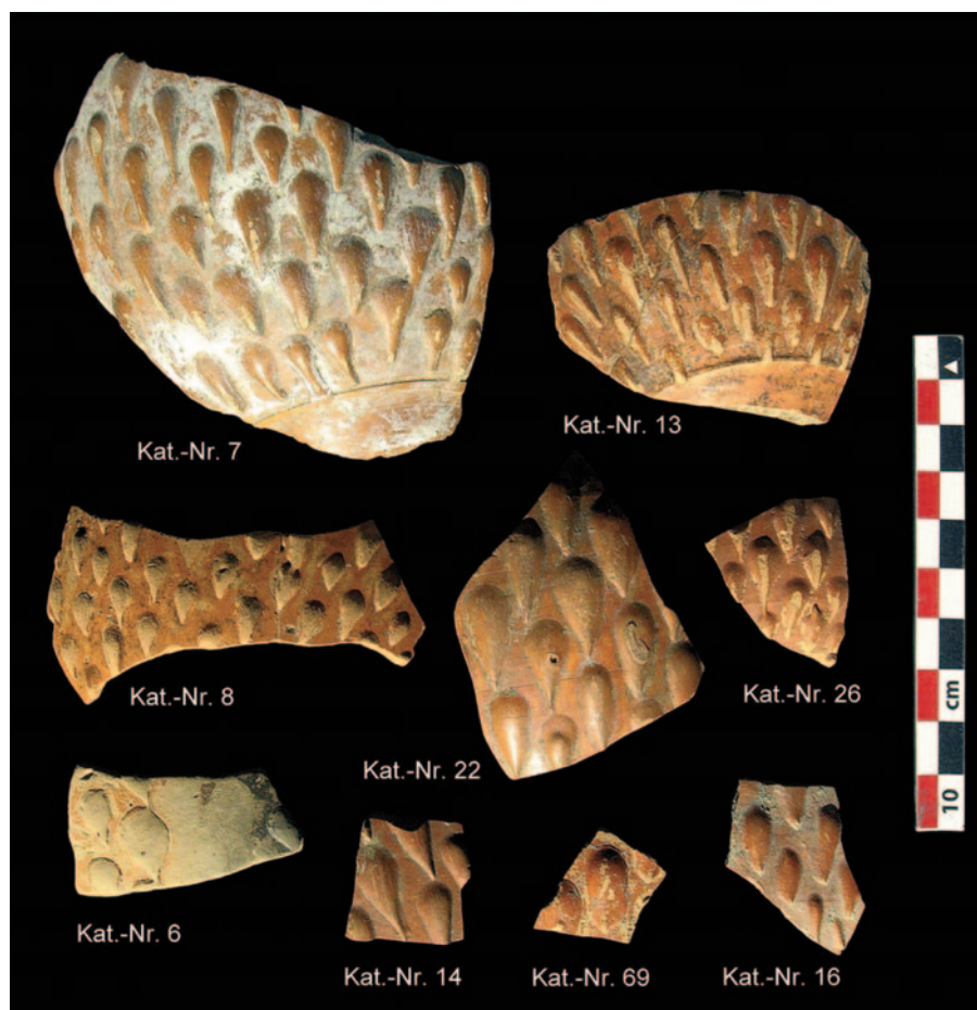
Obr. 2. VINDOBONA/Wien. Římská jemná keramika s barbotinovými kapkami. Canabae legionis: č. 6–8, 13–14, 16; civilní sídliště: č. 22, 26, 69 (podle Eleftheriadou 2014).

(Droberjar 1993, 65–67, Tab. 2). Pouze v bohatém germánském hrobě v Mušově byla objevena barbotinová keramika, ale zcela jiného typu a s odlišnou výzdobou (Droberjar 2002, 411–413, Abb. 1). Na území barbarika však již byla keramika zdobená barbotinovými kapkami nalezena. Fragменты pocházejí z germánských sídlišť v dolnorakouském Straningu (Pollak 1980, Taf. 139:1; Eleftheriadou 2014, 146, Tab. 1) a z Velkého Mederu na Slovensku (Varsik 2004, 261, Abb. 4:7; Eleftheriadou 2014, 146, Tab. 1). Ve Velkém Mederu spočíval malý fragment barbotinové keramiky v objektu (č. 106, chata) datovaném do stupně C1 (Varsik 2004, Abb. 4:7; 2005, Abb. 3:11).