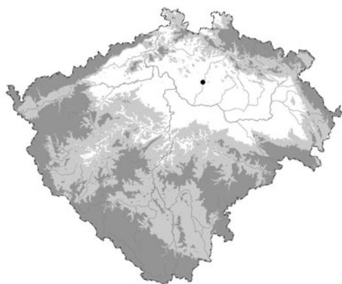
Obr. 1. Krnsko (okr. Mladá Boleslav). Mapa s vyznačením místa nálezu depotu (černý bod). Podklad: www.cuzk.cz . Vlevo: poloha lokality na mapě Čech.