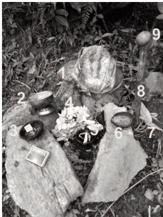
Obr. 5. Svatyně (Srí Lanka). Vysvětlivky viz text na následující straně.

V této věci jsme se obrátili na profesora archeologie Raje Somadevu (Univerzita Kelaniya, Srí Lanka). Že se jedná o obětiště bylo sice (nepřekvapivě) po-