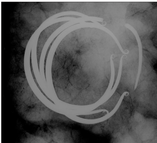
Obr. 3. RTG snímek depotu z Krnska.