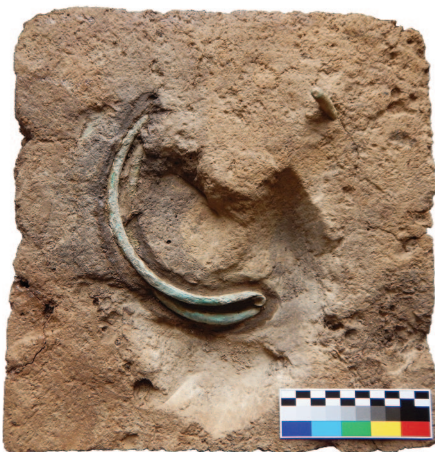
Obr. 4. Depot z Krnska v současné podobě. Foto Filip Krásný.

vitých hřívěn (k hřívěm např. Menke 1982 a Moucha 2005). Jedna hřívna je rozlomena, ostatní nevykazují žádné poškození (obr. 3). Na tomto pracovišti byl také nález adjustován pro výstavní účely, jelikož rozebráním a vyhodnocením čtyř hřívnovitých nákrčníků bychom žádnými novými poznatky k otázce výzkumu depotů patrně nepřispěli. V této podobě je uložen v depozitáři archeologického oddělení Muzea Mladoboleslava (obr. 4). 1