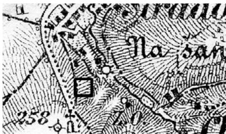
Obr. 6. Přibližná poloha Holubova hlavního naleziště na speciální mapě 1:75 000 z roku 1881 (vyznačeno čtvercem)