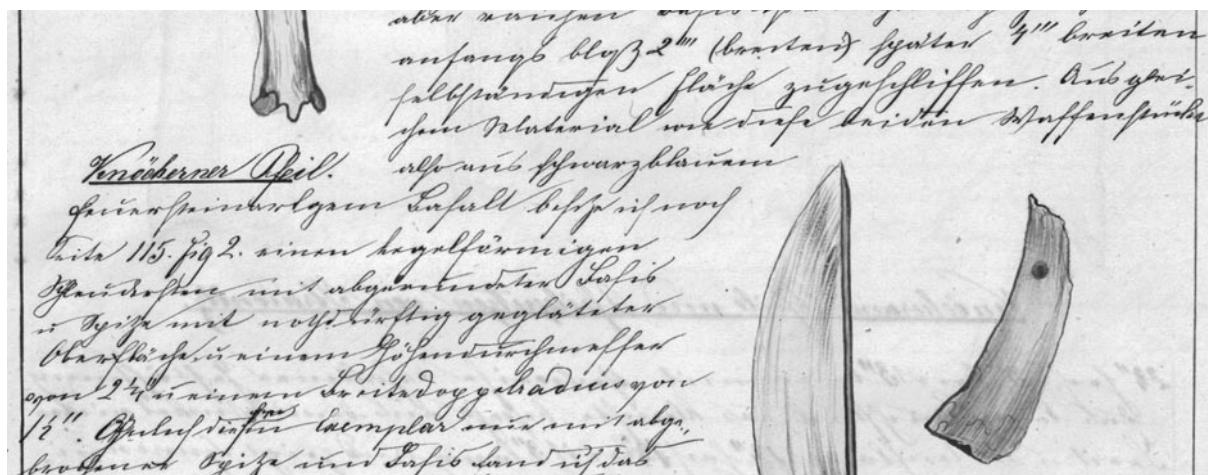
Obr. 3. Výřez z textu rukopisu Tagebuch – Reisen, str. 127.

Podle předmluvy začal psát 8. února 1870, ale toto datum se nejspíše týká čistopisu, protože úvodní části (popis krajiny, geologie, přírody, historie, pověsti) působí dojmem, že byly připraveny nanečisto už dříve. Naopak archeologické nálezy (resp. archeologická část Holubových sbírek) jako nejrozsáhlejší část rukopisu jsou sice také popsány se snahou o systém, ale přesto působí dojmem méně důkladné přípravy