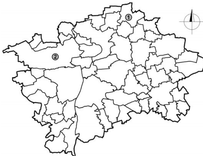
Obr. 1. Poloha nálezů na plánu Prahy. 1: Cukerní ulice, Praha-Čakovice, 2: Veleslavínská ulice, Praha-Veleslavín.

Při dvou zatím nepublikovaných předstihových archeologických výzkumech v severních částech Prahy byla v letech 2016 a 2017 nalezena dvě hliněná závaží s neobvyklou výzdobou. První z nich pochází z Cukerní ulice v Praze-Čakovicích (ppč. 139 a 143; Rytíř a kol. 2017; Kacl 2018 ), druhé bylo rozpoznáno v náleзовém souboru z prostoru mezi ulicemi Pod Dvorem, Veleslavínskou a U Zámečku v Praze-Veleslavíně (ppč. 143, 144, 145/1, 145/2, 146/2, 146/8, 147; Kacl a kol. 2018 ); ( obr. 1 ). Nálezy obdržely inventární čísla archeologické sbírky Muzea hlavního města Prahy, a to A 689227 (Čakovice) a A 701026 (Veleslavín).