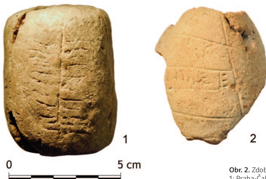
Obr. 2. Zdobená hliněná závaží.