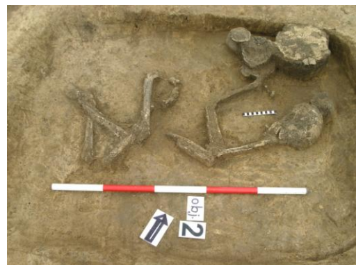
Pravděpodobně ženský pohřeb kultury se šňůrovou keramikou.