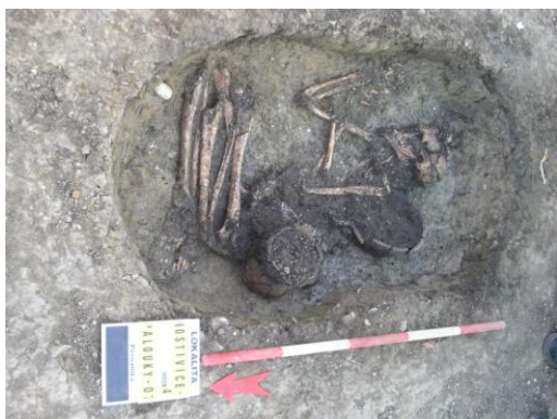
Pravděpodobně pohřeb ženy z období zvoncovitých pohárů