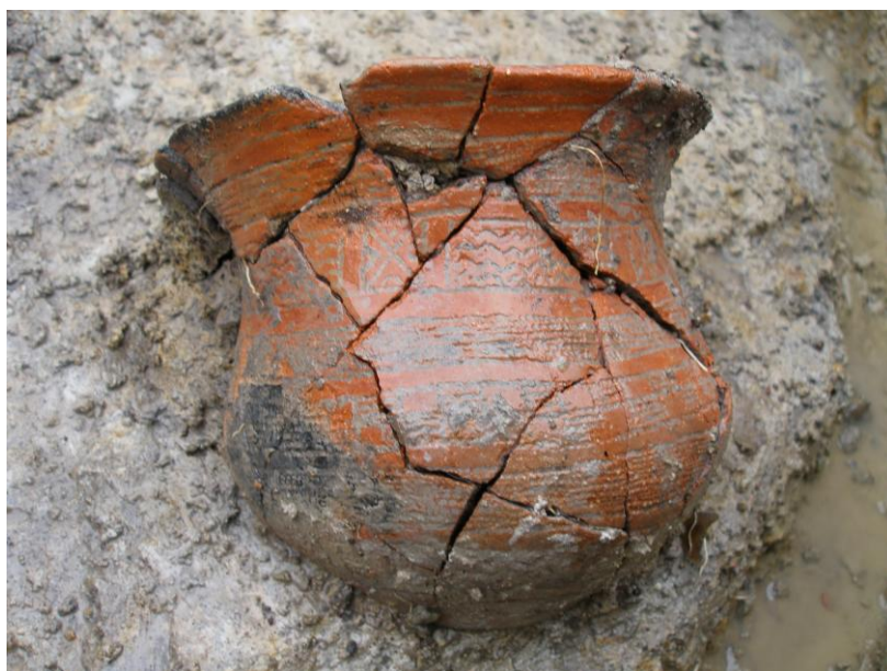
Detail zvoncovitého poháru