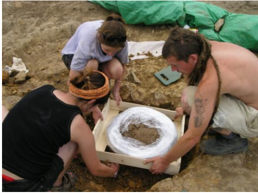
Velké nádoby byly ze všech stran utěsněny montážní pěnou a po jejím vytvrzení byl sloupek hlíny pod nádobou odříznut a vše bezpečně převezeno do keramické laboratoře.