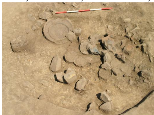
Komorové hroby bylanské kultury starší doby železné obsahovaly spálené lidské ostatky a velké množství keramických nádob.

Kromě dvou pravěkých staveb s kúlovou konstrukcí bylo odkryto především pohřebiště kultury bylanské starší doby železné. Skrývky odhalily nejprve několik ojedinělých žárových pohřbů uložených v keramických urnách. Dále bylo odkryto 6 komorových hrobů s žárovými pohřby. Spálené lidské ostatky byly objeveny na dně hrobu, v jeho severozápadním rohu, jako prostá hromádka obložená bohatým keramickým inventářem. Takové bohaté hroby byly v Hostivicích letos objeveny hned čtyři. Všechny měly mezi 17 a 22 nádobami, ale i další milodary, jako je železný nůž na porcování pečeně, spona na spínání šatů, a další drobné železné předměty a kování. Dva z urnových hrobů zase obsahovaly bronzové náramky. Velké množství více než 70 nádob prochází nyní rekonstrukcí, rovněž se provádí digitalizaci plánů odkrytých objektů a hrobů a vytváří databázi dat souvisejících výsledky archeologického výzkumu.