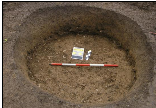
Sídlištní objekt č. 5