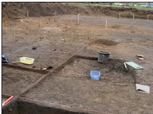
Pohled na zkoumanou plochu.

prozkoumány i dva hliníky a čtyři křulové jamky. Všechny objekty lze datovat do neolitu, konkrétně do období kultury s lineární keramikou.