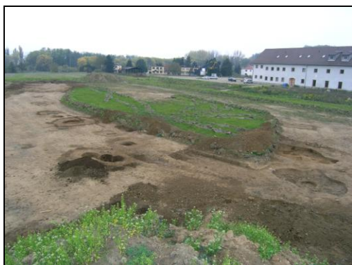
Pohled na zkoumanou plochu.

Na jaře minulého roku bylo na katastrálních území Lipence a Zbraslav započato s úpravou stávajícího terénu pro budoucí golfové hřiště. Na severovýchodním okraji tohoto areálu, na lokalitě zvané Peluněk, v místě kde se dle původního plánu měla nacházet jedna z několika vodních ploch, bylo zachyceno celkem 53 archeologických objektů sídlištního charakteru a několik recentních zásahů. Z tohoto celkového počtu tvořily celou jednu třetinu novověké objekty převážně kruhového tvaru (jámy po stromech?). Ostatní objekty byly zastoupeny zásobnicemi kruhového tvaru, menšími jámami kruhového či oválného tvaru, z nichž některé mohly plnit rovněž funkci zásobnic, dále středně velkými objekty oválného a nepravidelného tvaru a kulevými jamkami. Tyto objekty lze předběžně datovat dílem do neolitu (některé zásobní jámy), dílem do doby pozdně halštatské až časně laténské (převážně středně velké objekty nepravidelného či oválného tvaru).