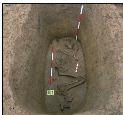
Mužský pohřeb s lukostřeleckou výstrojí.