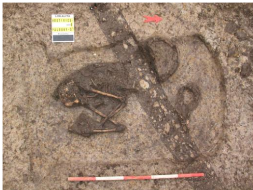
Hrob porušený meliorací