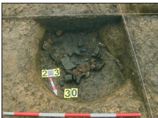
Severovýchodní část sídlištního objektu č. 2.

Na podzim minulého roku bylo v prostoru I. a zčásti II. etapy výstavby „Obytného areálu Chuchle – Hvězdárna“ zachyceno několik desítek archeologických objektů. Převážná většina z nich se koncentrovala v jižní a východní části I. etapy; v prostoru II. etapy plynule navazující na etapu I. byly evidovány již jen objekty dva. Celkem bylo prozkoumáno 95 objektů sídlištního a pohřebního charakteru. Ze sídlištních objektů tvořily většinu křulové jamky, méně často již byly zastoupeny malé až středně velké objekty rozmanitých tvarů většinou s obtížně určitelnou funkcí. Ostatní druhy sídlištních objektů jako jsou například hliníky a zásobní jámy se vyskytly jen sporadicky. V deseti případech pak byly zaznamenány hrobové celky. Až na jedinou výjimku se jednalo o hroby kostrové spadající do období kultury se zvoncovitými poháry. Většina z nich se nacházela v jihovýchodním rohu zkoumané plochy. Zde byl pohřben dospělý muž s lukostřeleckou výstrojí a dvěma měděnými předměty, žena a pět dětí. Západně od této skupinky, rovněž v blízkosti jižního konce zkoumané plochy, se samostatně nacházely i zbylé dva kostrové hroby z tohoto období. Severním směrem těchto hrobů byl pak prozkoumán jediný žárový pohřeb rámcově zatím datovatelný do neolitu až neolitu.