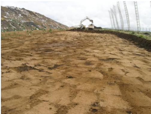
Počáteční fáze skryvek v předpolí skládky.

Záchranný výzkum vyvolaný rozšiřováním skládky odhalil dvě rozsáhlé jámy s nálezy keramiky z období řivnáčské kultury středního eneolitu, dále pak pozůstatky splachu s větším množstvím erodované pravěké keramiky. Odkryt byl rovněž jeden pravděpodobně ženský pohřeb z období kultury se šňůrovou keramikou.