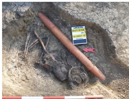
Pohřeb s keramickou výbavou porušený meliorací.