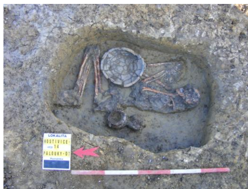
Pravděpodobně pohřeb ženy