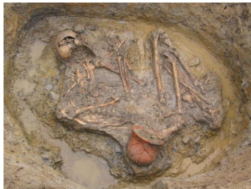
Pravděpodobně mužský pohřeb se zvoncovitým pohárem