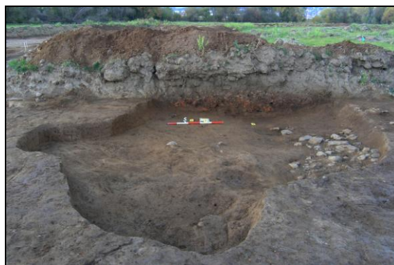
Sídlištní objekt č. 1.