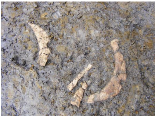
Kostěné lukovité závěsky z mužského hrobu