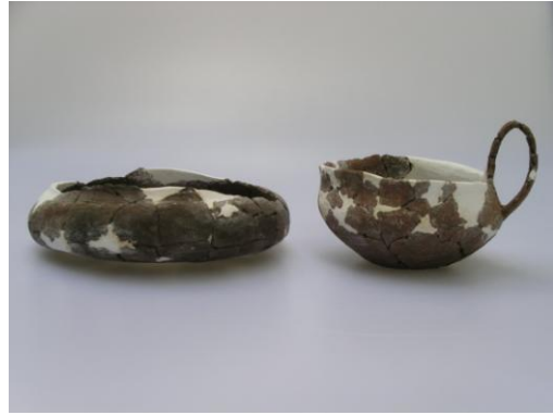
Pohřební keramika bylanské kultury v průběhu rekonstrukce.